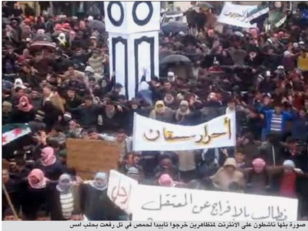
صورة بثها ناشطون على الانترنت لنشطاء خرجوا تأييدا لحمص في تل رفعت بحلب امس

عواصم - وكالات: انقسمت معظم المناطق السورية أمس بين مناطق خرج فيها الآلاف للمطالبة بإسقاط النظام في جمعة «المقاومة الشعبية».. بداية مرحلة.. أخرى عاشت تحت القصف العنيف والمتكثف وحملات عسكرية متصاعدة خاصة بعد تصويت الجمعية العامة للأمم المتحدة بأغلبية ساحقة على مشروع القرار العربي الذي يدين قمع النظام السوري للمدنيين.