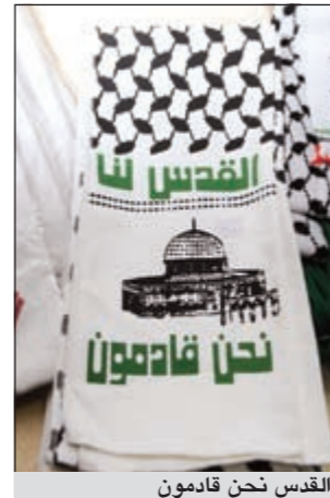
القدس نحن قادمون