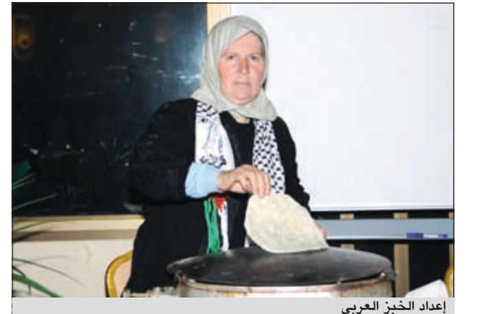
إعداد الخبز العربي