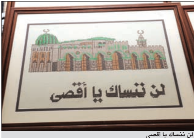
لن ننسك يا أقصى