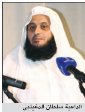
الداعية سلطان الدغليبي

أكد الداعية سلطان الدغليبي أن مجالس الذكر والصحية الصالحة فضلا كسيرها في هداية الشباب وارشادهم الى طريق الصواب مما يبعدهم عن الملهيات، مبينا انه اتخذ قرارا شجاعا بتغيير مسار حياته من سب أن الله لا يغير ما يقوم حتى يغيروا ما بأنفسهم، عندما شعرت بلذة كبيرة في بداية مشوار الالتزام والصلاة.