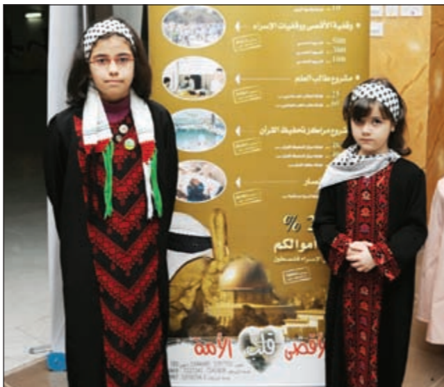
طفلتان تشاركان أمام بوسنر «أجلك يا أقصى»

وقال الدغليبي خلال البرنامج الـ 13: اننا بحاجة الى تغيير كل ما هو خطأ في حياتنا، ناصحا الشباب بالابتعاد عن السرعة القاتلة التي تسبب في انهيار الأسر، اذا تحولت حياتهم الى نقمة بعد ان كانت نعمة من خالقهم، مطالبا إياهم بأخذ العبر من الحوادث الأليمة التي نراها يوميا ويذهب ضحيتها عدد كبير من الشباب. وأضاف ان من الشباب من يستغلون رمضان في غير الطاعة فتجدهم يذهبون ضحية تلك الحوادث وهم غير مدركين بأن الحياة قصيرة ويجب استغلالها