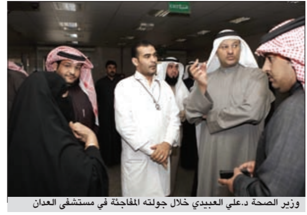
وزير الصحة د.علي العبيدي خلال جولته المفاجئة في مستشفى العبدان

الجاري، وإرسالها إلى الوزارة، ليعتمدها الوزير د.علي العبيدي، وإصدار قرار رسمي بخصوصها. ولغقت إلى أن الوزارة طلبت من مديري المناطق اختيار الأقسام الأصغر والأكبر لشغل منصب رئيس قسم في المستشفيات، كما طلبت الوزارة ضخ دماء جديدة شابة لشغل هذه المناصب. وتوقعت المصادر أن يتولى التغيير في اختيار رؤساء الأقسام الطبية في المستشفيات قد انتهت في الشهر الجاري، مينة أن مديري المناطق سيختارون من ترشيح واختيار رؤساء الأقسام نهاية فبراير عبد الكريم العبدالله علمت «الأنباء» من مصادر صحية مطلعة أن وزارة الصحة قامت بمخاطبة جميع مديري المناطق الصحية للقيام بترشيح واختيار رؤساء الأقسام الطبية في جميع مستشفيات الوزارة. ونكرت أن المدة القانونية لشغل رؤساء الأقسام الطبية بمهامهم في المستشفيات قد انتهت في الشهر الجاري، مينة أن مديري المناطق سيختارون من ترشيح واختيار رؤساء الأقسام نهاية فبراير