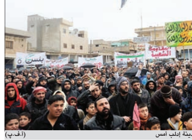
مظاهرات سوريةون ضد النظام في مدينة ادلب أمس (أ.ف.ب)

عواصم - وكالات: غداة تبني الجمعية العامة للأمم المتحدة بغالبية ساحقة تجاوزت 137 دولة مقابل رفض 12 دولة لقرار عربي يدعو إلى وقف الغوري لحملة القمع العنيفة التي يشنها النظام السوري على المناهضين له، تجددت المظاهرات في عدة مدن سورية أمس تحت شعار «جمعة المقاومة الشعبية.. بداية مرحلة»، وإذ دعم القرار جهود الجامعة العربية لضمان انتقال ديموقراطي ويوصي بتعيين موفد خاص للأمم المتحدة إلى سورية، أسفرت عمليات القمع التي شهدتها المظاهرات عن سقوط ما يزيد على 45 قتيلاً برصاص الأمن الغليظ في درعا وحمص وحلب ودمشق، بموافقة ذلك حددت قوات الجيش قصفها العنيف المستمر منذ أسبوعين على حمص وحمص لإسما بابا عمرو والخالدية والبيضاء. سياسياً، أكد الرئيس السوري بشار الأسد خلال استقباله رئيس الوزراء الموريتاني مولاي ولد محمد لغظف، أن خطوات الإصلاح السياسي التي تقوم بها الدولة لا بد أن تسير بالتوازي مع إعادة الأمن والاستقرار وحماية المواطنين. من جانبه، وصف نائب وزير الخارجية الروسي ميخائيل بغدانوف أمس «مجموعة أصدقاء سورية»، التي تنوي الاجتماع في تونس 24 الشهر الجاري بأنها مجموعة «هواة» التدخل في سورية بما في ذلك عسكرياً في انتهاك للقانون الدولي وشرعة الأمم المتحدة، وقال «لأسف مررنا بهذه الحالة قبل ذلك في ليبيا وتجربتنا لا يمكن اعتبارها إيجابية»، وهو ما نفاه وزير الخارجية التونسي رفيق عبد السلام مؤكداً أن هذا المؤتمر لا يهدف إلى استنساخ النموذج الليبي، وقال أنه سيعقد