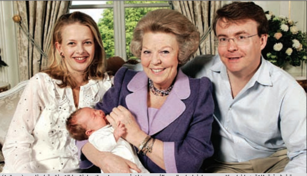
صورة أرشيفية لملكة هولندا بياتريس مع ابنها ولي العهد الأمير يوهان فريسو وزوجته وابنتها الكونتيسة لونا

عواصم - وكالات: لمدة 15 دقيقة، دفن النجل الأوسط لملكة هولندا الأمير يوهان فريسو تحت أكوام الثلج في انهيار ثلجي بالنمسا قبل أن يتمكن رجال الإنقاذ من انتشاله. وأعلنت الحكومة الهولندية مساء أمس أن الأمير يوهان فريسو في حالة حرجة في وحدة الرعاية الفائقة في مستشفى انسبروك بعد أن طعمه الانهيار الجليدي، بينما أكد رئيس وزراء هولندا مارك روت أن ملكة هولندا بياتريس لم تصب بأذى في الانهيار. وكانت الأسرة الملكية تقضي عطلتها الشتوية في منتجع ليخ غربي النمسا حيث وقع الحادث. المالية في العالم اجمع، استعدادها للتحرر ووقف خدماتها لدى المؤسسات المالية الإيرانية المعاقبة على أساس قانون أوروبي يجري اعتماده حالياً. وأوضح البيان أن هذا القرار اتخذ إثر مشاورات مطولة بين مجلس إدارة سويقت، ومقرها بروكسل وسلطات الضبط المالي المختصة. وأضاف أن هذا القرار يعكس أيضاً الظروف غير العادية والاستثنائية جدا للدعم الدولي والمتعدد لتكثيف العقوبات على إيران. الفاصل ص 28