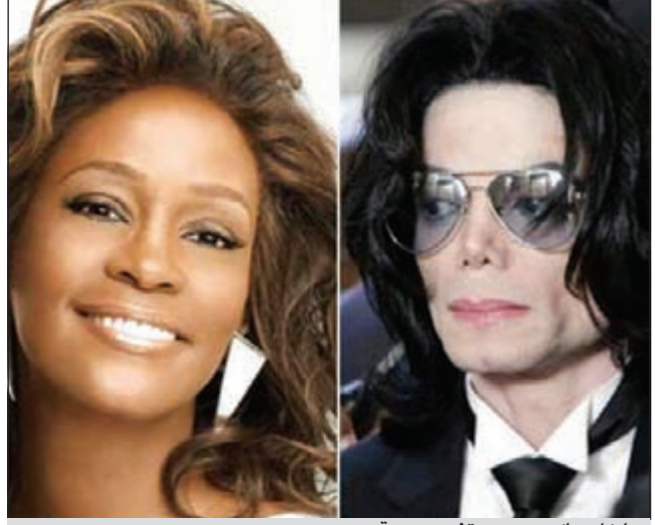
مايكل جاكسون وويتني هيوستن

ولعل وفاة ملك البوب مايكل جاكسون تعيد إلى أذهاننا السيناريو نفسه، حيث تمت إدانة طبيب جاكسون بسبب إعطائه «كوكيتل» من المهدئات أدت في نهاية المطاف إلى إنهاء