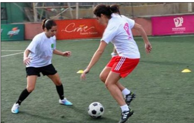
فتيات يلعبن كرة القدم في بيروت

أشار إلى أن الفريق المكون من الفئة الأكبر سناً، أو فريق الكبار، سيشارك في بطولة كأس لبنان في كرة القدم وجميع البطولات التي تجري في لبنان، مرحباً بفكرة السودان هناك أيضاً مدرسة كرة قدم، لكن الأكاديمية اللبنانية تتميز بانها تقبل الفتيات حصراً. وأكد عرقجي أن الهدف من وراء تأسيس هذه الأكاديمية هو