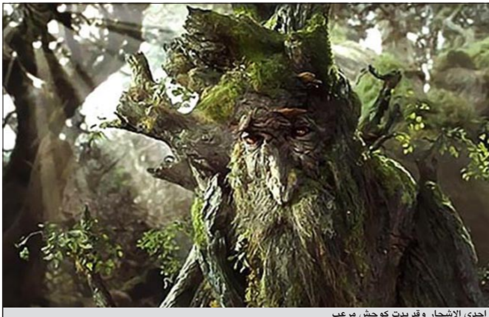
أحد الاشجار وقد بدت كوحش مربع

بروكسل - أ.ف.ب: انتقدت وسائل اعلام بلجيكية مدرسة ابتدائية فلمنكية في جيتي في ضاحية بروكسل لاعتمادها نظاماً لغويًا جديداً ينص على ساعات «عقاب» للتلاميذ الذين يتحدثون الفرنسية في باحة المدرسة خلال الاستراحة. وذكرت