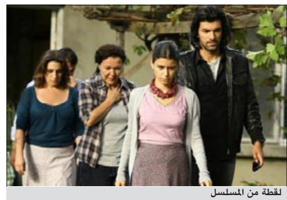
لقطة من المسلسل

تركيًا - وكالات: بعد الانتهاء من تصوير المسلسل التركي «ما ذنب فاطمة غول» والذي تلعبه فيه دور البطولة الممثلة التركية برين سات المعروفة بـ«سمر»، بدأت الفضائية بعرض المسلسل منذ أيام وقد أثار أحد المشاهد في الحلقة الأولى غضب الشارع التركي عند عرضه، مما أثار حفيظة البرلمان التركي فقام النواب بمناقشة هذا المسشهد بالتحديد وطلوبوا وقف عرض المسلسل. المشهد يحاكي اعمال مشيئة بحق فاطمة، حيث تظهر المخرجة التفاصيل بوضوح وسط بكاء وصراخ البتلة مما أثار مشاعر المشاهدين بسبب ما تعرضت له من إيذاء بدني. من جهتها، اصدرت الجمعيات النسائية بيانا طالبت فيه باستمرار عرض المسلسل كي يظهر للمشاهد مساوى القانون التركي فيما يخص قضية الاعمال المشيئة بحق الفتاة والثغرات في القانون التي تسمح للمعتدي بالافلات من العقاب.