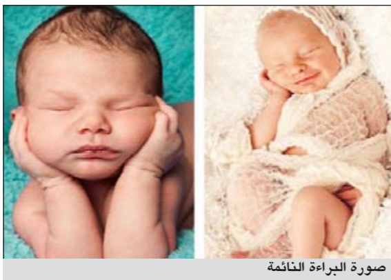
صورة البراءة النائمة

أم.بي.سي: تخصص مصور اميركي بتصوير الأطفال الصغار وحديثي الولادة وهم نائمون، فهو ينتظر الأطفال ساعات حتى يغطون في النعاس فيصورهم.