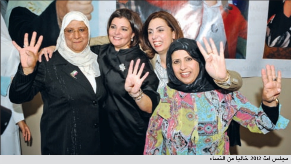
مجلس أمة 2012 خاليا من النساء