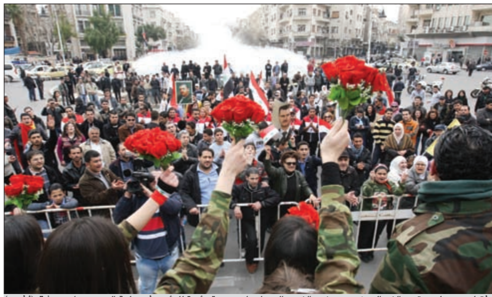
فتيات سوريات يرتدين الزي العسكري ويوزعن الزهور الحمراء على مسيرة مؤيدة للرئيس في ساحة السبع بحرات بدمشق

عواصم - وكالات: فيما يستمر التباين في المواقف الدولية تجاه القرارات العربية الأخيرة حول الأزمة السورية التي تنهي اليوم شهرها الحادي عشر، مازالت حمص والليواء العاشر على التوالي تحت أعنف قصف تشهده أي من المدن المتفتحة على نظام الحكم في سورية.