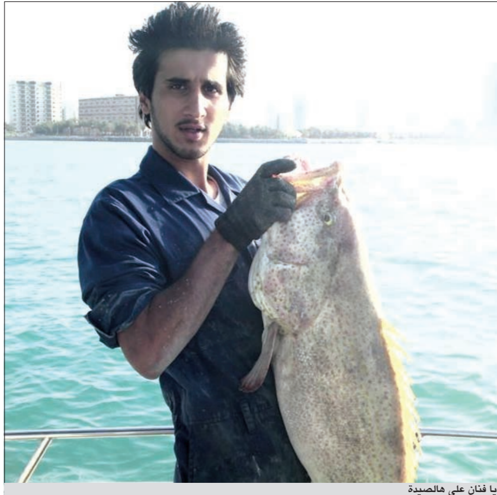
يا فنان على هالصيد

فيها ممتاز، فما الحدائق التي يفضلها دشتي؟ ● من المعروف دائماً ان لكل محقق موسماً ووقتها معنا يكون الصيد فيه ولا أروع ودائماً التواخذه الكبار يعرفون تماماً المواسم كاسمائهم، فلهذا تجدهم دائماً عاندين من الصيد بكميات طيبة من الاسماك ما شاء الله عليهم، والسبب كله يعود الى خبرتهم القوية وطرقهم الفنية بالصيد، اما الجانب الآخر وأصدق اصحاب الخبرة القليلة فتجدهم احياناً يتحسرون على سمكة واحدة والسبب يعود وبكل تأكيد الى قلة الخبرة والممارسة وعدم معرفة المواسم وأوقات الصيد وكل همهم ان يدخلوا بالطراد للمحور ويرمون خيوطهم فقط وأنا من خبرتي المتواضعة وجدت ان الدفان والبوية الصفرا وقاروره والفنطاس من افضل الحدائق التي مرت علي لأنها تمتاز بالصيد الوفير والاقواق الطيبة وتنوع الاسماك.