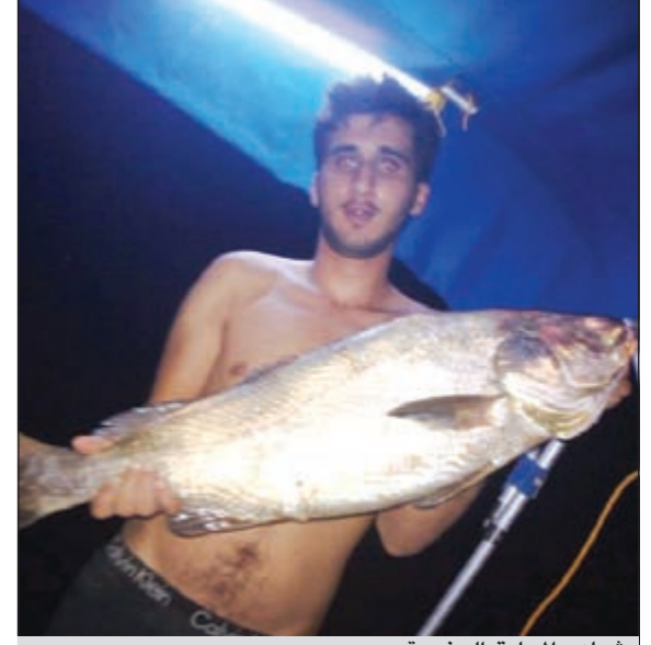
شماهي المحائق الجنوبية

للتواصل «بحري» صفحة تستقبلكم كل أربعاء بكل ما يعنى بالبحر وهواية الحدائق ● اسبوعيا نسلط الضوء على هذه الهواية، ونستقبل مشاركاتكم وصوركم وآراءكم. للتواصل معنا عبر هذه الصفحة أرسلوا تعليقاتكم على الایمیل: bahri@alanba.com.kw ● اعداد: عادي العززي