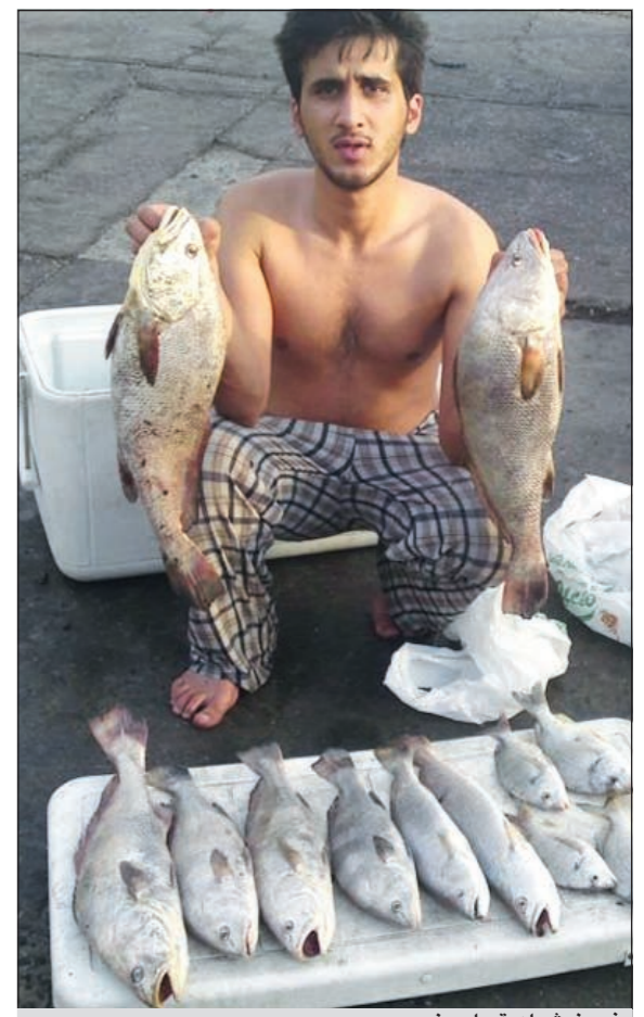
فروخ شماهي يا عيني