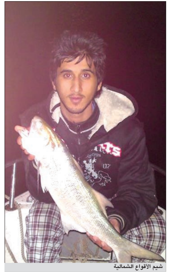
شمم الاقواق الشمالية