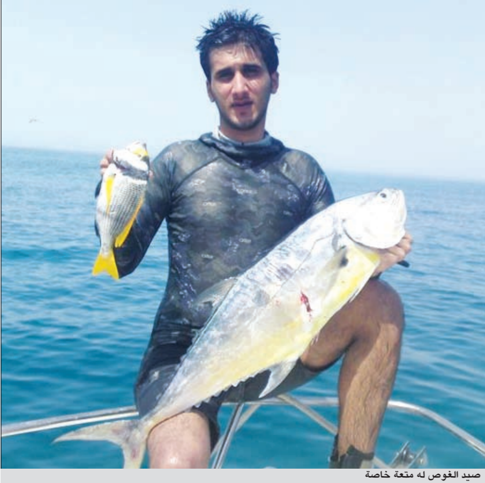
صيد الغوص له متعة خاصة