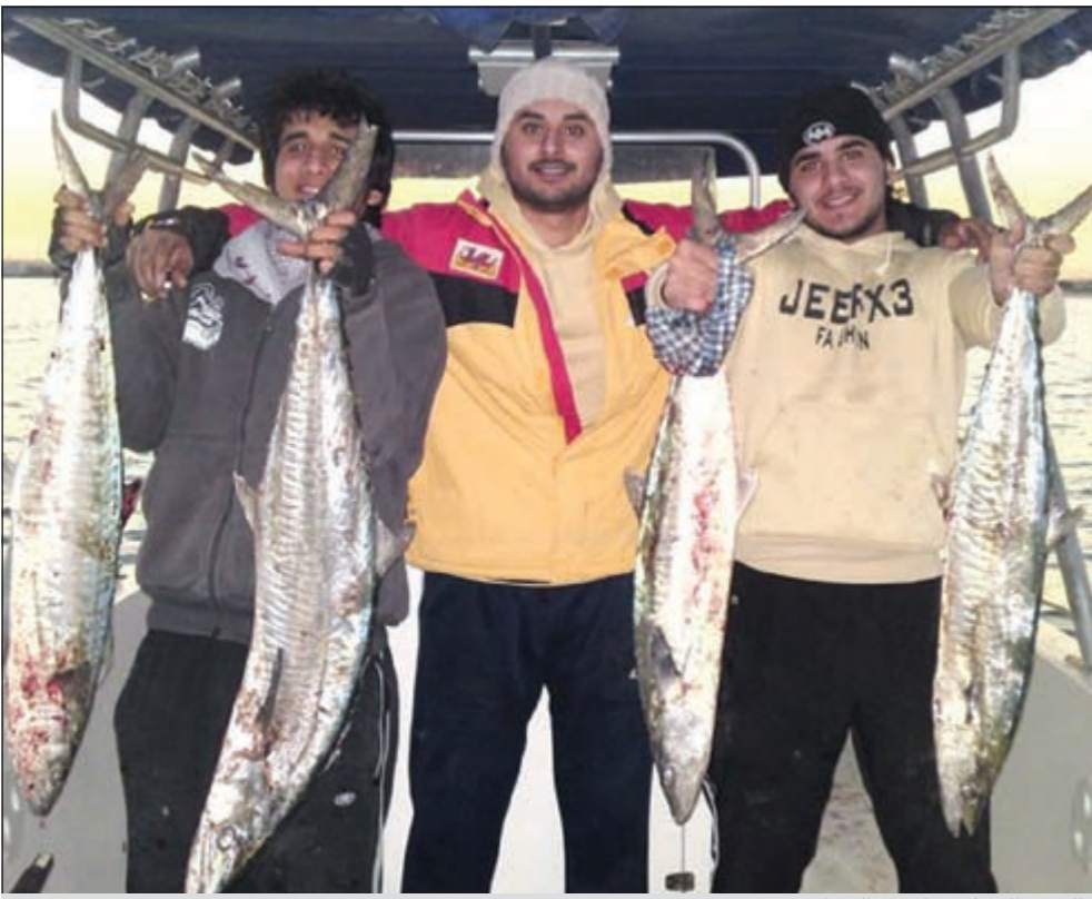
الصيد الجماعي بإحدى الرحلات