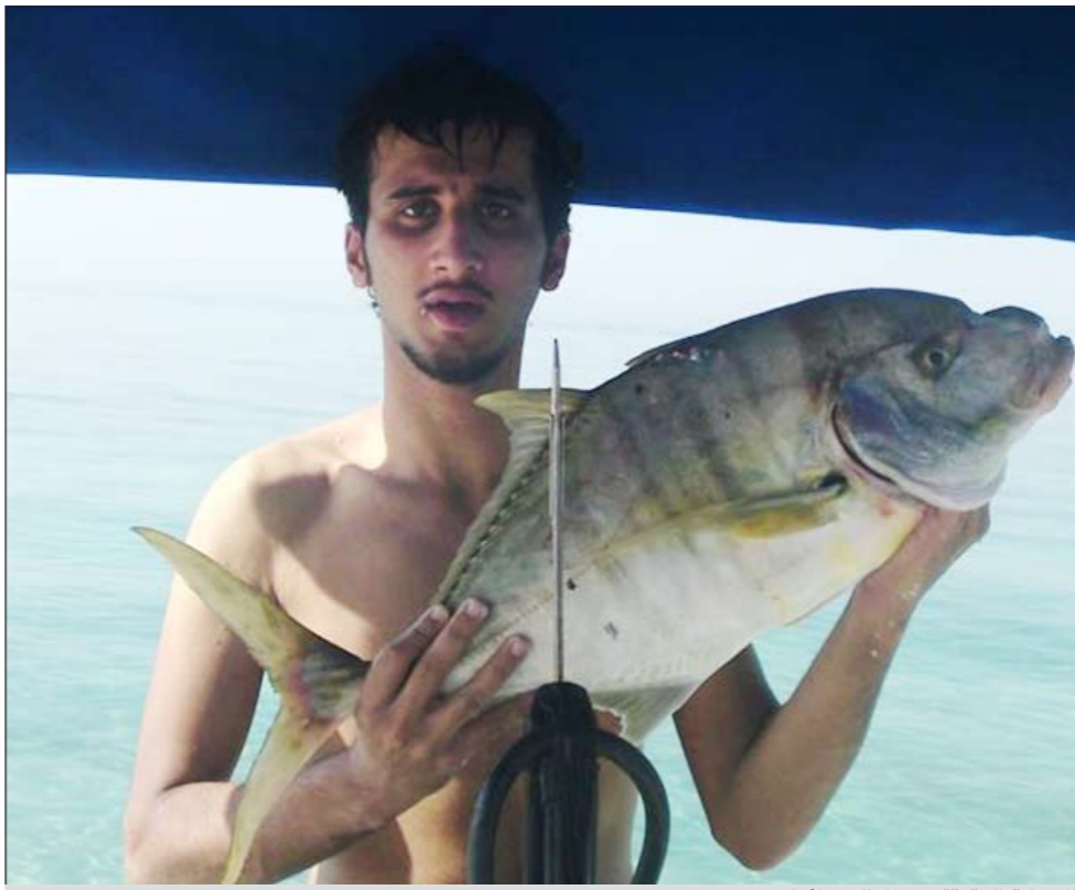
الإصابة الدقيقة هي المطلب دائماً