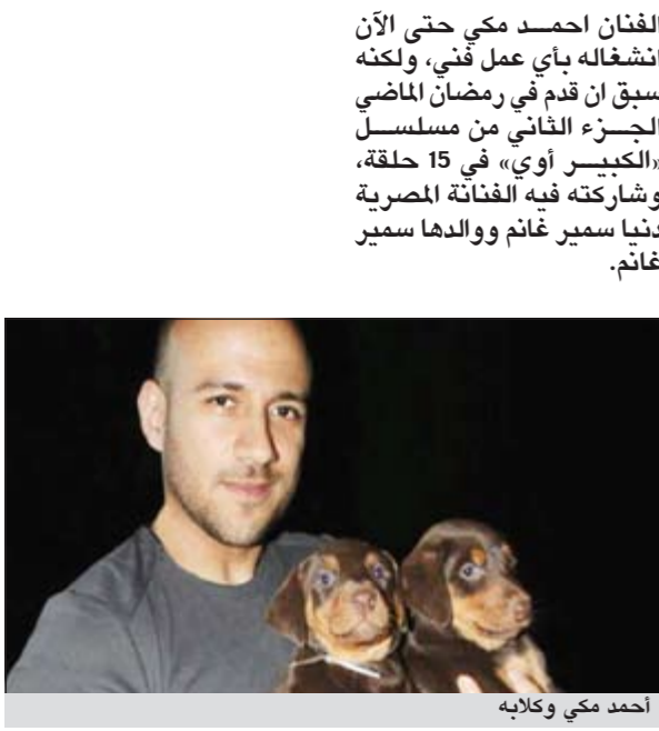
أحمد مكي وكتابه

على ما يبدو ان الفنان احمد مكي قد بدأ يتقمص في الحقيقة شخصية دهب في فيلمه «طير انت» حيث انه اصبح مصاباً بهوس الكلاب لدرجة حرصه الشديد على الاعتناء بصحة كلابه الثلاثة بوضعهما بإحدى المدارس الأجنبية.