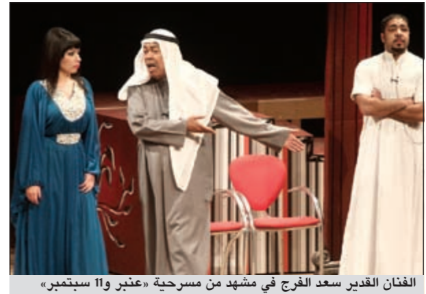
الفنان القدير سعد الفرج في مشهد من مسرحية «عنبر و11 سبتمبر»

وأكد السليطي أن رحلة عروض المسرحية ستستمر، حيث يدرس حالياً تقديم عروض لها في الإمارات، والتخطيط لتقديم عروض أخرى في سلطنة عمان. يذكر أن الفنان القدير سعد الفرج يشارك الى جانب السليطي في مسرحية «عنبر و11 سبتمبر»، كما يضم طاقم التمثيل كل من: الفنانة هبة الدري والفنانة البحرينية ماجدة سلطان وفاطمة الطباخ وعبدالعزیز الصايغ ويدر الشطي وعلي القلاف وسلمان المرزوق.