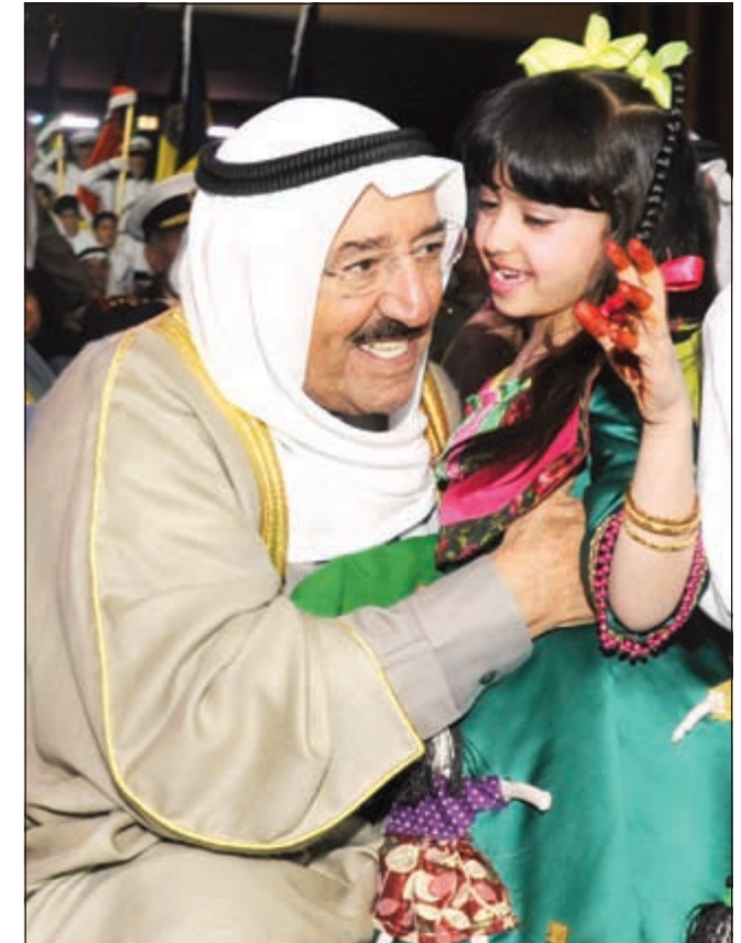
صاحب السمو الامير في لفته ابوية مع إحدى زهرات الكويت