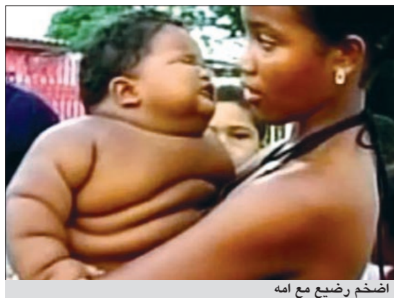
أضخم رضيع مع امه

دبي- ام.بي.سي: يعاني رضيع كولومبي من زيادة غير طبيعية في وزنه، حيث إن عمره 11 شهرا فقط ووزنه 28 كيلوغراما، رغم أنه ولد بوزن طبيعي كسائر الأطفال العاديين، وهو يعد الطفل الأضخم على مستوى العالم، ونقل تلفزيون هيئة الإذاعة البريطانية «بي بي سي» عن والدة الطفل قولها إن نجلها كانت حالته طبيعية في بداية ولادته، إلا أنها اكتشفت زيادة هائلة وسريعة في وزنه خلال شهور بسيطة.