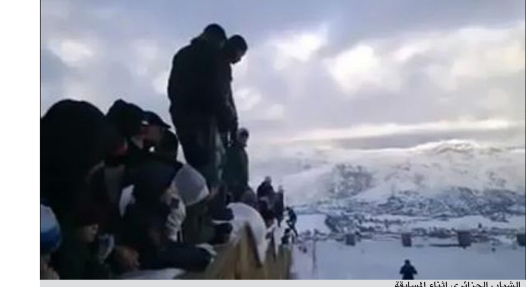
الشباب الجزائري أثناء المسابقة

الجزائر - ام بي سسي: نظم مجموعة من الشباب والمراهقين في مدينة المدية (120 كلم عن وسط الجزائر العاصمة) مسابقة للقفز من أعلى قمة نحو الثلج، في شكل مربع، وحقق الفيديو الذي بثه هؤلاء على موقع الفيديوهاث الشهير «يوتيوب» نسبة مشاهدة عالية في وقت قصير، في حين عبر الكثيرون عن فرحتهم وشعورهم بصدمة كبيرة من تهور هؤلاء. على الرغم من أن موجة البرد القارس التي اجتاحت البلاد منذ أكثر من أسبوع قد أحدثت حالة طوارئ غير مألوفة بسبب شل حركة المرور ووفاة أكثر من 50 شخصا بسبب اختناقات الغاز وحوادث المرور والموت بردا وجوعا، إلا أن عددا من الشباب الذين لم