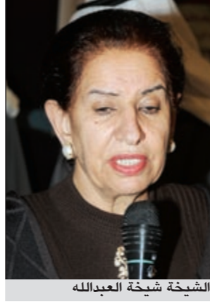
الشيخة شيخة العبدالله

تحت رعاية الشبيخة شيخة العبدالله الصباح الرئيس الفخري لجمعية المعاقين، وانطلاقاً مما جبل عليه المجتمع الكويتي من خصال حميدة وعادات وتقاليد عربية وإسلامية أصيلة، في فعل الخير والإحسان، وتعزيزاً لجهود البذل والعطاء المتميزة قسي مجتمعنا، يقام «المشروع الكويتي لذوي الاحتياجات الخاصة» الخاصة «أجيانا 2012» غداً الثلاثاء الموافق 14 فبراير 2012 بفندق شيراتون الكويت. ويشمل هذا المشروع إقامة أنشطة لذوي الاحتياجات الخاصة (اجتماعية وثقافية وترفيهية ورياضية) ومعرضاً لدعم ذوي الاحتياجات الخاصة في مختلف الأنشطة لتأهيل المعاقين وضمان حقوقهم الإنسانية كمواطنين ودمجهم