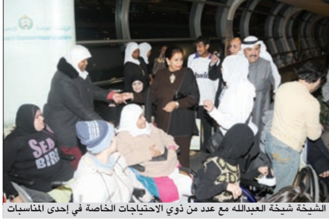
الشيخة شيخة العبدالله مع عدد من ذوي الاحتياجات الخاصة في إحدى المناسبات

على قلوب الجميع. وسيحاضر في المشروع متخصصون في خدمة ذوي الاحتياجات الخاصة لعرض أهم القضايا وطرق علاجها مثل اختلافات التعلم، ونسب انتشار صعوبات التعلم، واضطراب التوحد (مفهومه) - أعراضه - العلامات المبكرة التي تساعد على اكتشافه) والعديد من ورش العمل في كيفية التدخل مع الأفراد ذوي الاحتياجات الخاصة الذين يعانون من اضطرابات في اللغة والكلام والتدخل المبكر مع الأطفال ذوي اضطرابات التوحد، بالإضافة إلى أنشطة تساهم في حل مشاكلهم ويشترك بالمشروع جهات حكومية وخاصة بالتعاون وعرض بعض النماذج التي تغلّبت على الإعاقة وحققت الانجازات والبطولات الرياضية وفي شتى المجالات.