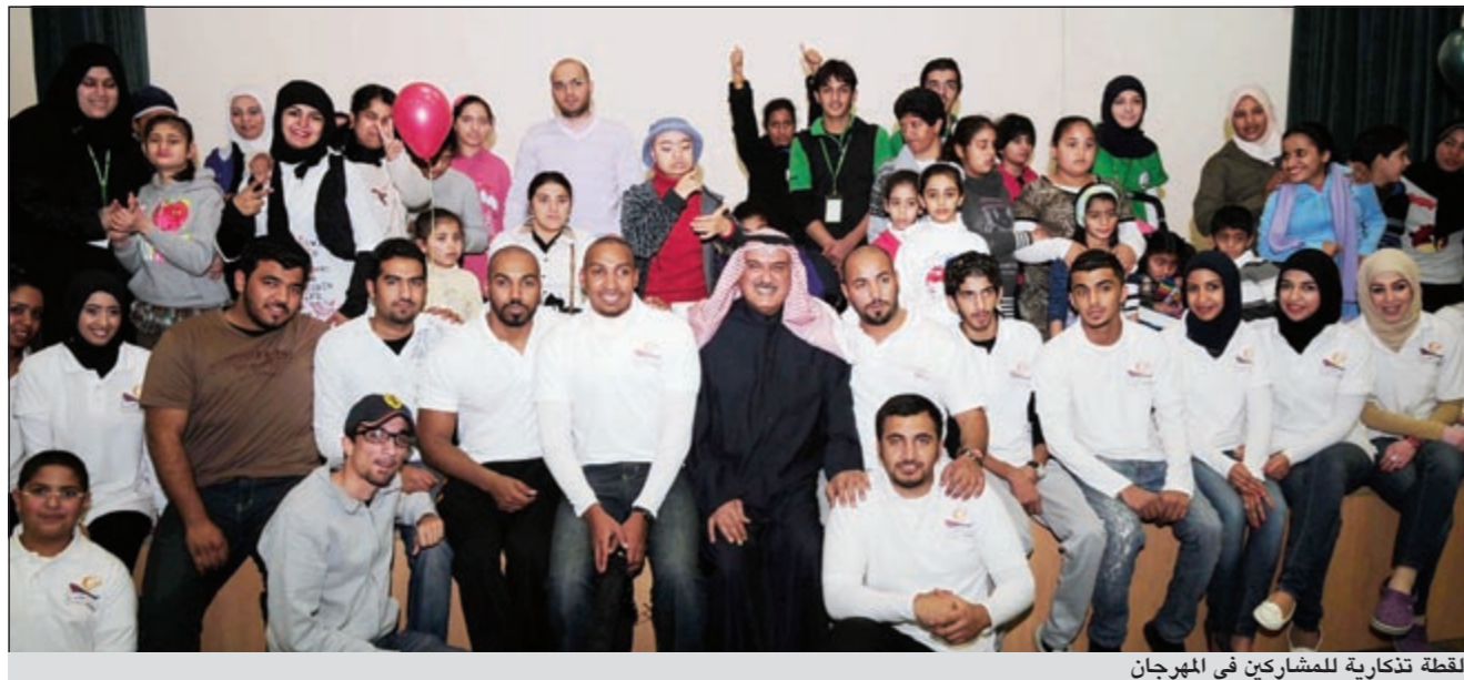
لقطة تذكارية للمشاركين في المهرجان

تحت شعار «رحلة الأمل» رسالة إنسانية، أقيم في مركز الخرافي للتوحد حفل ختام مهرجان رحلة الأمل، حيث قام عدد من متطوعي فريق نشر المحبة بالتعاون مع مجموعة من المشرفين والإخصائيين بالمركز بالتدريب على كيفية التعامل مع هذه الفئة وكيفية دمجهم بالمجتمع والتعامل معهم، حيث قام 60 شاباً وشابة، بإدارة المركز خلال يناير 2012 إضافة إلى القيام بمجموعة من الأنشطة الترفيهية شملت بعض الألعاب التربوية، مثل الرسم الذي عبر عن روح الأمل لدى المعاقين والعروض السينمائية، وقد تخلل هذه الأنشطة إشراف متطوعي الفريق على الأطفال بإقسام المركز من مرسوم ومكتبة ومسرح وصالة الألعاب وحديقة المركز.