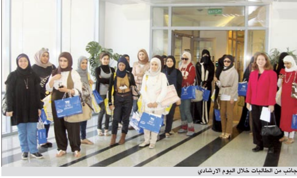
جانب من الطالبات خلال اليوم الإرشادي

نظمت كلية بوكسهل الكويت للبنات يومين إرشاديين للطالبات المستجدات للفصل الدراسي الثاني 2012/2011 في صالة العرض بالكلية. وانطلق اللقاء الإرشادي بكلمة ترحيبية كان مضمونها تشجيع وتحفيز الطالبات على استغلال الفصل الدراسي بجد ونشاط لكي يحققن أهدافهن، وتضمن اللقاء عرضاً شاملاً عن الكلية وخصوصياتها وطبيعة الدراسة فيها والخدمات المتوافرة للطالبات، كما تم من خلال هذا اللقاء تقديم شرح تفصيلي عن التخصصات والبرامج الأكاديمية بالكلية، وكذلك عن آفاق المستقبل الوظيفي للخريجات وقامت الكلية بتنظيم جولة