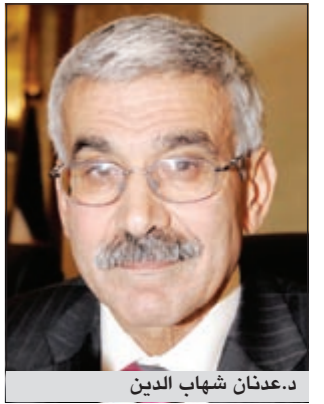
د.عدنان شهاب الدين

يستضيف الصالون الإعلامي في ندوته المقامة اليوم في تمام الساعة السابعة مساءً د.عدنان شهاب الدين مدير عام مؤسسة الكويت للتقدم العلمي وذلك في مقر الصالون الإعلامي الجديد الكائن في بيت العثمان بشوارع العثمان في حولي. وستناقش الصالون عدداً من القضايا والأمر المتعلقة بدور مؤسسة الكويت للتقدم العلمي في الكويت وتشجيعها وبحثها الدائم عن المبدعين أصحاب المشروعات والمنجزات العلمية.