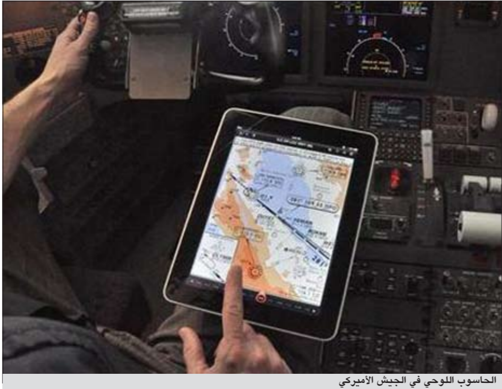
الحاسوب اللوحي في الجيش الأمريكي

واشطنن - يو.بي.أي: تعرض موقع الاستخبارات المركزية الأمريكية «سي سي آي» الإلكتروني للقرصنة على يد أشخاص استخدموا راية مجموعة القرصنة الشهيرة «مجهولون». وأفادت وسائل إعلام أميركية أن موقع الـ «سي آي إي» توقف