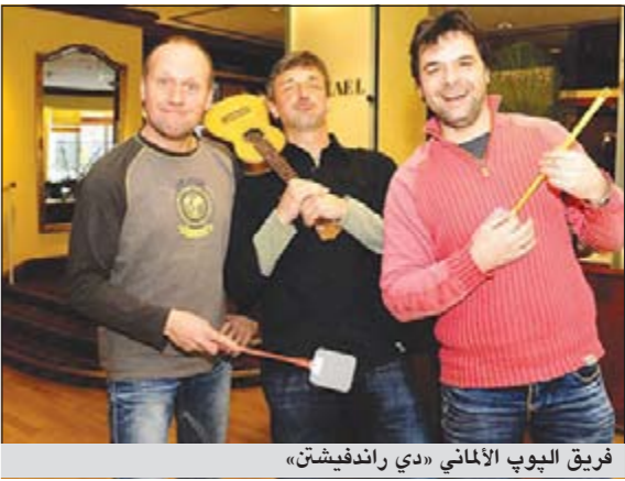
فريق البيوب الألماني «دي راندفيشثن»

وكالات: تنخفض درجات الحرارة حاليا إلى 5 درجات مئوية تحت الصفر في جميع المدن الألمانية، ولن تجرؤ أي ذئابة على إزعاج الناس في هذا البرد القارس، إلا أن «طنين» أغنية الذئابة أزعج جمعية الرفق بالحيوان.