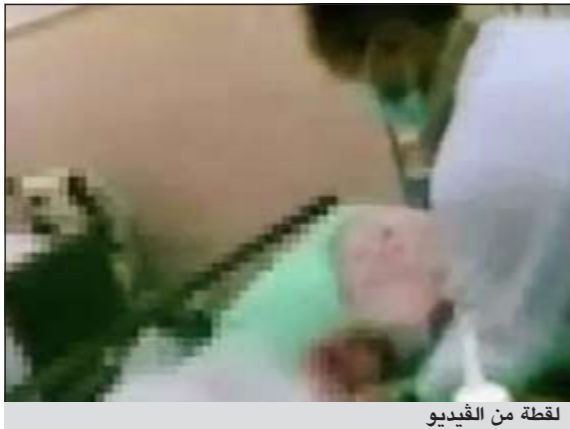
لقطة من الفيديو

العربية: أثار مقطع فيديو نُشر على موقع لانتترنت ويحتوي على مشاهد تعكس سوء معاملة طفلين معاقين في مركز التأهيل الشامل في محافظة عفيف الراي العام السعودي بحسب تقرير لقناة «العربية» الخسيس الماضي. ويكشف الفيديو، الذي بثته صحيفة إلكترونية محلية، عن تعرض الطفلين إلى تعنيف كبير من قبل العاملين في المركز. ويقول محمد المعدي من هيئة حقوق الإنسان في السعودية إنه تم إرسال لجنة لتقصي تفاصيل القضية في مركز التأهيل الذي يبعد عن العاصمة الرياض نحو 500 كيلومتر. من جانبه، يؤكد د.عبدالله اليوسف وكيل وزارة الشؤون الاجتماعية للرعاية والأسرة أن المشهد يكشف عن تعامل عنيف مع أحد الأطفال أثناء تغذيتهم بواسطة انبوب. وقال أن وزارة الشؤون الاجتماعية أرسلت لجنة للمركز للتحقيق في الواقعة.