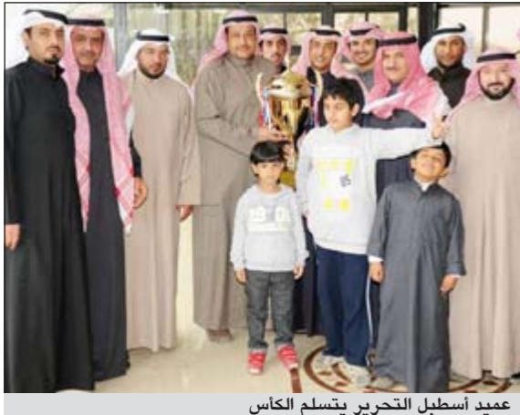
عميد أسطبل التحرير يتسلم الكأس

حقق الجواد «بيرق التحرير» لاسطبل التحرير بقيادة الخيال جيفري فوزا صعبا عندما شن هجوما عنيفا على أسطبل الدرجة الثالثة الفائتة خصوصا «عصمان» الذي كان قاب قوسين أو أدنى من خط النهاية ليكسب كأس المغفور له الشيخ عبدالله المبارك.