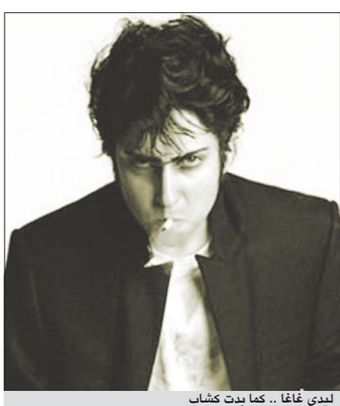
ليدي غاغا .. كما بدت كشاب

أصبحت ليدي غاغا معروفة أيضا بشخصيتها الثانية «alter ego» الا وهو جو كالديرون، حيث ظهرت بهذه الشخصية في حفل الـ MTV العام الماضي كما ظهرت بهذه الحلة في كليها الأخير «YOU AND I» حيث تقوم بعدة شخصيات منها جو وحورية البحر، وما هي تعود غاغا في فيديو جديد يظهرها بشخصية جو، وتظهر غاغا المثيرة للجدل كالشاب تماما تشتم وتدخن السجائر، وكشفت عن التصديق الذي يغطي صدرها.