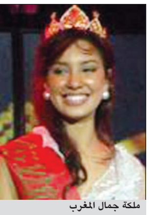
ملكة جمال المغرب

الدار البيضاء - ام.بي.سي: أعرب مغاربة عن غضبهم من إقامة حفل تنصيب ملكة جمال