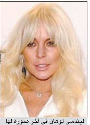
ليندسي لوهان في آخر صورة لها

لوس أنجلوس - أ.ش.أ: ما زالت نجمة هوليوود ليندسي لوهان تثير المشاكل والأزمات لكل من حولها في كل مكان تتواجد فيه، وآخرها الضوضاء التي سببتها لجيرانها في منجع «شنتل» فيينيسيا «الهادئ» الذي يهرب إليه سكان هوليوود للاستجمام والراحة.