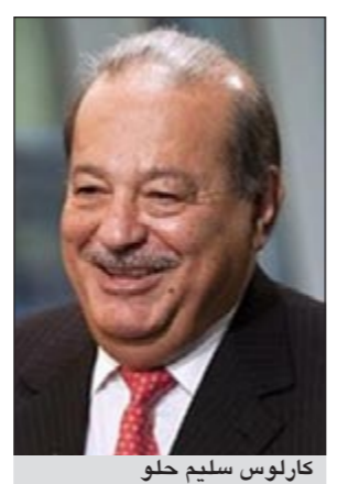
كارلوس سليم حللو

«هذه الموانئ» المستمدة من رواية بالفرنسية بهذا العنوان، فيما عنوانها «موانئ المشرق» بالعربية، وهي لأمين معلوف، اللبناني الأصل المقيم في فرنسا والحاصل على جنسيتها.