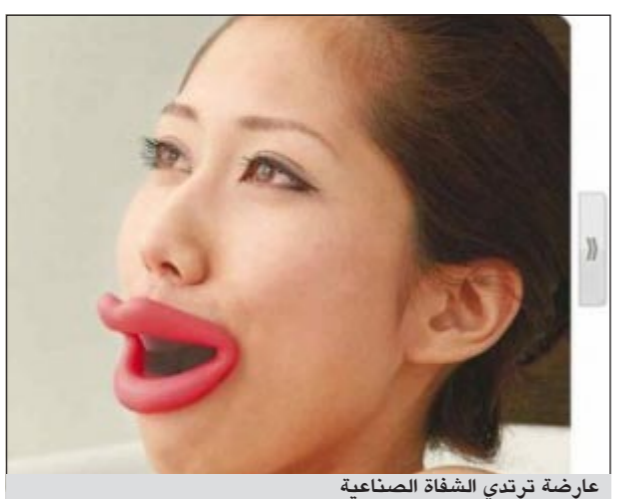
عارضة ترتدي الشفاة الصناعية

تقاوم التجاعيد شفاه صناعية للحفاظ على الوجه ومقاومة لظهور معالم الشيخوخة عليه، ولهذا يطلق عليها اسم «Face Slimmer». وتضع الشفاه من المطاط، وهي كيبيرة الحجم وتوضع على الشفتين الحقيقيتين، وتوظفها هي لتاجيل ظهور التجاعيد على الوجه من خلال قيام الشفتين الصناعيتين بالتحرك بينما ويسارا ولأعلى والأسفل، وذلك لتمارين عضلات الوجه وشدها.