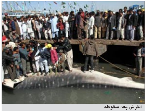
القرش بعد سقوطه

ام - بي - سسي: نجح باكستانيون في صيد سمكة من نوع «الحوث القرش» يبلغ طولها 40 قدما من بحر العرب، حيث أظهرت الصور التي نشرتها صحيفة بريطانية السمكة العملاقة، وهي مريوطة على السفينة وسط دهول وإعجاب مئات المتفرجين. وكما تشير صحيفة «الديلي ميل» فقد تم جلب ماكتنبتين للرفع لسحب حثة القرش من الماء، إلا أن الأمر قد فشل لنقل وزن السمكة الضخمة، فاضطر الصيادون