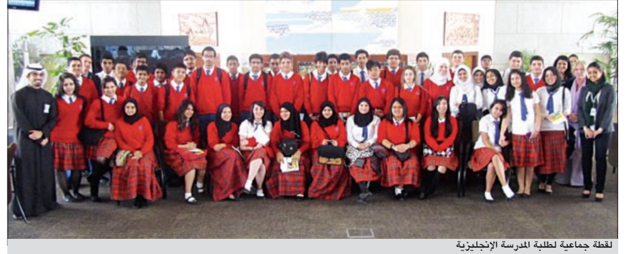
لقطة جماعية لطلبة المدرسة الإنجليزية

استقبل بنك الكويت الوطني طلبة من المدرسة الإنجليزية في الفحيحيل في زيارة ميدانية للتعرف على كآبة على طبيعة العمل المصرفي وأسلوب عمل مختلف إدارات البنك.