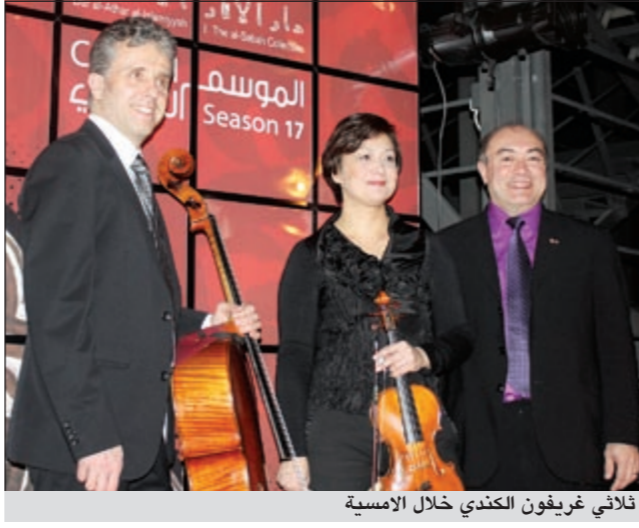
ثلاثي غريغون الكندي خلال الأمسية

الإسلامية ضمن فعاليات موسمه الثقافي الـ 17 محاضرة للدكتورة فيرتشايلد ريجل من جامعة الينوي الانسنين المقبل بعنوان «العتق والذوق في الحديقة الإسلامية». وقالت الدار في بيان صحفي أمس إن المحاضرة ستسلط الضوء تاريخياً على تطور الحدائق الإسلامية من خلال الوصف المكتوب عنها والشعر الذي نظم فيها والمنمنمات المصورة والصور الفوتوغرافية.