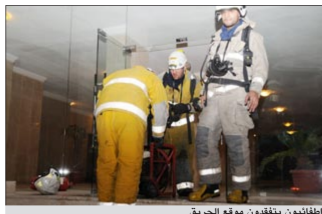
اطفائيون يتفقدون موقع الحريق

بالدور الثاني من العمارة المكونة من 6 ادوار وسرداب وتبلغ مساحة المكان حوالي 2000 متر مربع تقريبا حيث كان الدخان كثيفا مما استدعى من رجال الإطفاء إخلاء العمارة بالكامل من قاطنيها، وأشار المقدم الامير الى ان من بين الأشخاص الذين تم إخلاؤهم كبار سن وأطفال، لافتاً الى انه تم تشكيل فرقتين للمكافحة والإنقاذ حيث قامت الفرقة بإنقاذ الأشخاص المحشورين من الدخان، اما فرق مكافحة فعملت على مكافحة