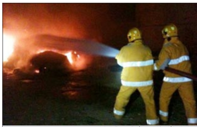
رجال الإطفاء خلال مكافحة حريق الطراد