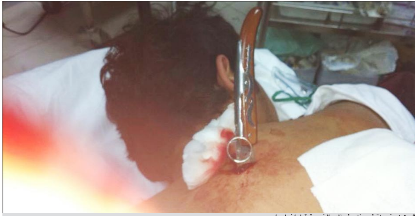
السكين مغروزة في منتصف ظهر الضحية قبل اخراجها

الجيران، مما تطور الى التشابك بالأيدي وإقدام الجاني على إخراج سكين وتثبيتها بالمجني عليه الذي اجتمع الأطباء والاستشاريون الذين أدخلوه الأشعة التي بينت أن السكين على مقربة من النخاع الشوكي الذي يتطلب الحذر في إجراء العملية التي استغرقت نحو الساعتين. حيث تكلم الخنجر إخراج بالنجاح والتحفظ عليه وتسليمه الى جهة الاختصاص، وأعاد المصدر بان خلافاً نشب بين الشاب العشريني وأحد أبناء