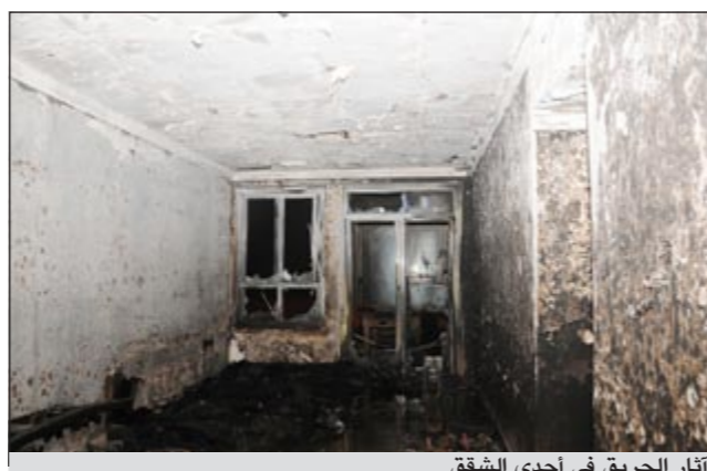
آثار الحريق في إحدى الشقق