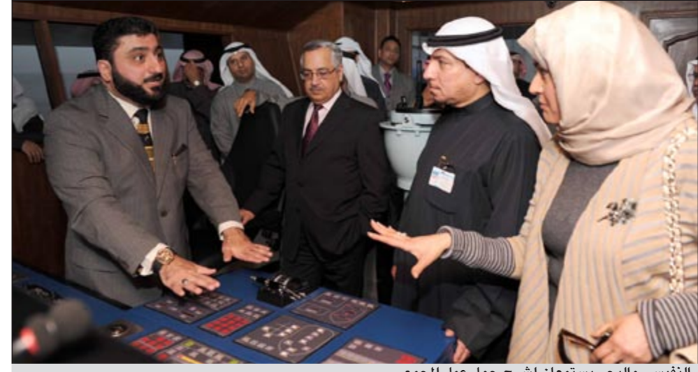
النفيسي والبحر يستمعان لشرح حول عمل المجمع

وأشار الكندي الى اننا بصدد انتظار الموافقة على الطلب الخاص بالمرحلة الثالثة ليتمثل مع مجمع المحاكيات الملاحي والذي يعد فخراً ليس للهيئة فقط بل للكويت، الذي سيمتلك أول مجمع محاكي على مستوى المنطقة، أما المرحلة الثالثة فتتكون من محاكي قطر TUG SIMULATOR وهذا المحاكى سيتم توصيله بغرفة قيادة السفينة ليتم توزيع المتدربين على المحاكى لتنفيذ عملية ربط السفينة على الرصيف أو مغادرتها له من خلال تعامل المتدربين مع بعض وكائهم في ميدان العمل، ولعل المفاجئة التي نملكها هي اننا تمكننا وبشكل كبير من إقناع مؤسسة الموانئ الكويتية ليتم تركيب محاكي الواقع الجسري الذي ستمتلكه قريباً، لتكون بذلك جاهزين لجميع احتياجات ميناء مبارك الكبير.