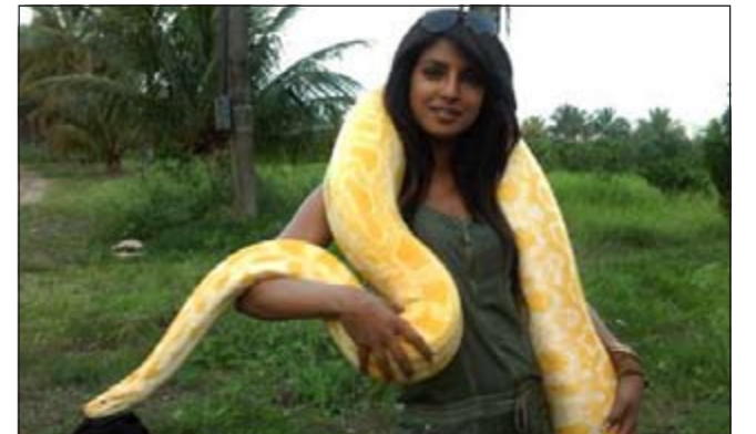
النجمة الهندية بريانكا شوبرا