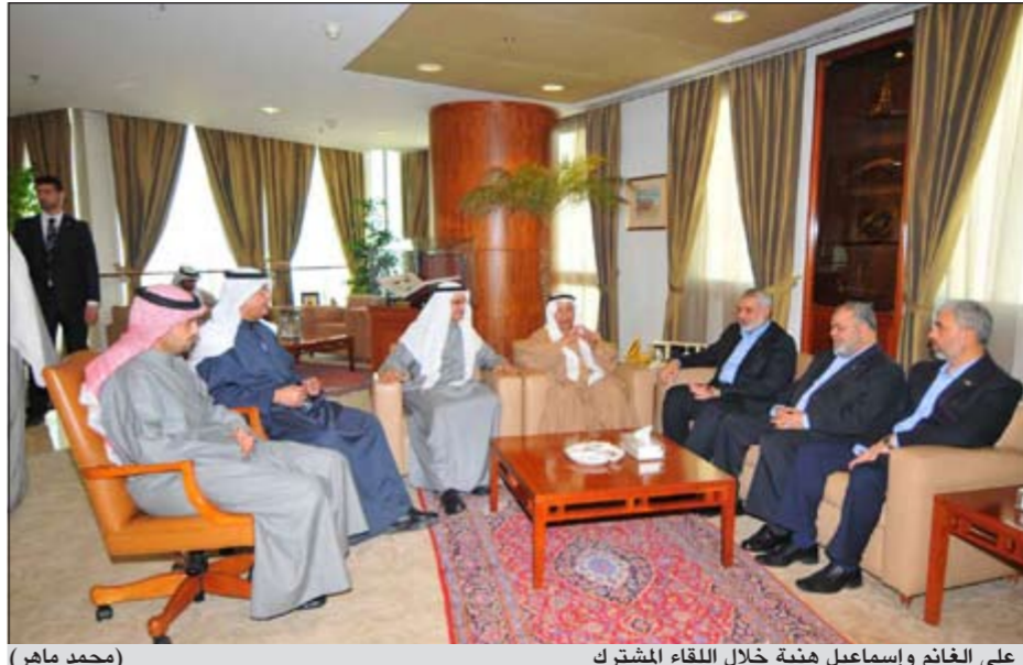
علي الغانم وإسماعيل هنية خلال اللقاء المشترك (محمد ماهر)

أثنى رئيس مجلس إدارة غرفة تجارة وصناعة الكويت علي الغانم على الجهود الكبيرة التي تبذلها الحكومة الفلسطينية لتحرير فلسطين. وقال الغانم في تصريحات صحافية عقب استقبال الغرفة لوفد الحكومة الفلسطينية برئاسة رئيس الحكومة إسماعيل هنية، ان الكويت ممثلة في غرفة التجارة والصناعة لن تالو جهدا في تقديم المساعدة للشعب الفلسطيني. وأعرب عن أمله في وجود تعاون خلال المستقبل القريب لمشاريع حيوية يقوم بها المستثمرون الكويتيون في فلسطين وعزة تشكل لبنة هامة في دعم الاقتصاد الفلسطيني.