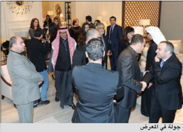
جولة في المعرض

المفروشات المنزلية رالف لورين هو اول مصمم أميركي يطلق مجموعة شاملة من رولين هوم 280 اس. كيو. ام الأثاث المنزلي الأنيق من أحدث تشكيلة، مستوحاة من أراضي الريف الإنجليزي ودرجات اللون والملمس الطبيعي الصحراوي وروح المغامرة في السفارة. تؤكد هذه التشكيلة المميزة من الأثاث المنزلي والمفروشات على السبب الذي اعتبر رالف لورين هوم لأجله الرائد في هذا المجال.