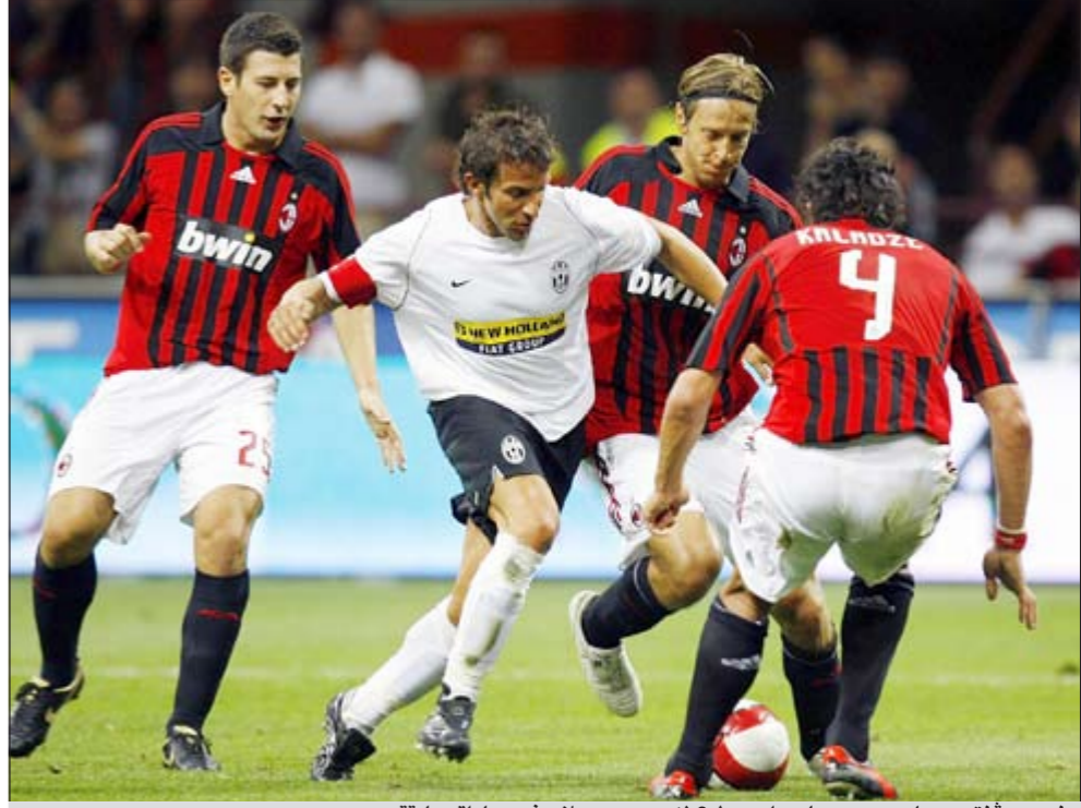
نجم يوفنتوس دل ببيرو محاصرا وسط 3 لاعبين من ميلان في مباراة سابقة

أشار اللاعب ماريو كيمبس الى أن السبب الرئيسي لتراجع مستوى مواطنه ليونيل ميسي في المباريات الأخيرة جاء نتيجة عدم حصوله على الراحة، مشيرا إلى قدرة برشلونة على الفوز بالدوري الإسباني رغم قوة ريال مدريد في هذا الموسم. وفي حديث للاعب جاء