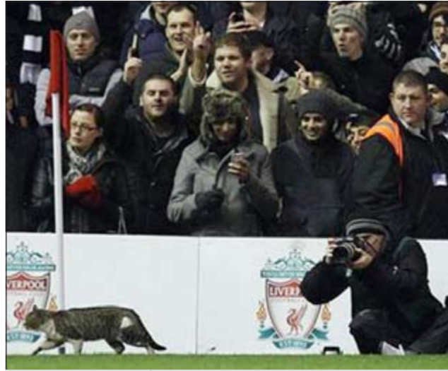
قطة على ملعب «انفيلد» تسببت في إيقاف مباراة ليفربول وتوتنهام دقيقة

لجنة الانضباط الخاصة بالدوري الإيطالي بالألقاب 3 مباريات بعد ان صفع مدافع نابولي سلفاتوري ارونكا في مباراة الأحد الماضي. كأس إسبانيا يأمل برشلونة، حامل الرقم القياسي بعدد الألقاب (25)، ان يؤكد تفوقه على فالنسيا عندما يواجهه اليوم في اياب نصف نهائي كأس إسبانيا ويبلغ المباراة النهائية للمرة الثانية على التوالي والمسماة والثلاثين في تاريخه. وكان برشلونة عاد من ملعب «ميسنتايا» بنتيجة ايجابية بعد ان تعادل مع فريق المدرب اوناسي ايمري 1 - 1 في مباراة اضعاف خلالها نجمه الأرجنتيني ليونيل ميسي ركلة جزء، ما يمنحه أفضلية بلوغ المباراة النهائية كونه يلعب امام جمهوره على ملعبه «كامب نو» حيث لم يذق طعم الهزيمة في 17 مباراة خاضها هذا الموسم في جميع المسابقات (14 فوزا و3 تعادلات). كما ان النادي الكاتالوني الذي استعاد توازنه السبب الماضي بفوزه في الدوري على سوسيسيداد (2 - 1) بعد