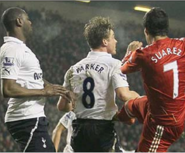
مهاجم ليفربول لويس سواريز يركل بطن لاعب توتنهام سكوت باركر بقدمه