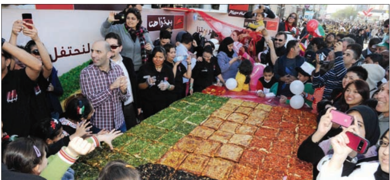
فرحة الحضور بالإعلان عن أكبر بيتزا هت على شكل علم الكويت

المناسبات الوطنية والاجتماعية عبر إطلاق وتنظيم العديد من الأنشطة المبتكرة والفريدة من نوعها. وقد لاقت المبادرة هذه تفاعلاً كبيراً من قبل الحضور الذي توافد للمشاركة في هذا الحدث الاستثنائي واستمتعوا بتناول هذه البيتزا الشهية عقب إطلاقها. وتعتبر بيتزا هت من أكبر العلامات التجارية في