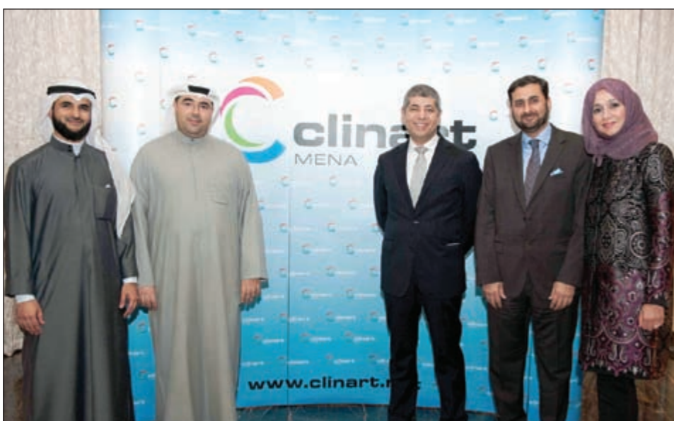
لقطة تذكارية بمناسبة إعلان «كلين آرت» عن علامتها التجارية الجديدة

قدمت «كلين آرت» الشرق الأوسط وشمال أفريقيا، أول منظمة إقليمية للأبحاث السريرية (الإكلينيكية) في منطقة الشرق الأوسط، رئيسها التنفيذي الجديد، وأعلنت عن علامتها التجارية الجديدة وشملت النقلاب عن خطة عمل مركزية للتوسع في مجال الأبحاث الطبية الإكلينيكية في المنطقة. وقد أتاحت استثمارات النمو الرأسمالي للشركة الكويتية للعلوم الحياتية مؤخراً إمكانية مواصلة النجاح في نمو كلين آرت الشرق الأوسط وشمال أفريقيا وتوسيعها السريع في منطقة الشرق الأوسط.