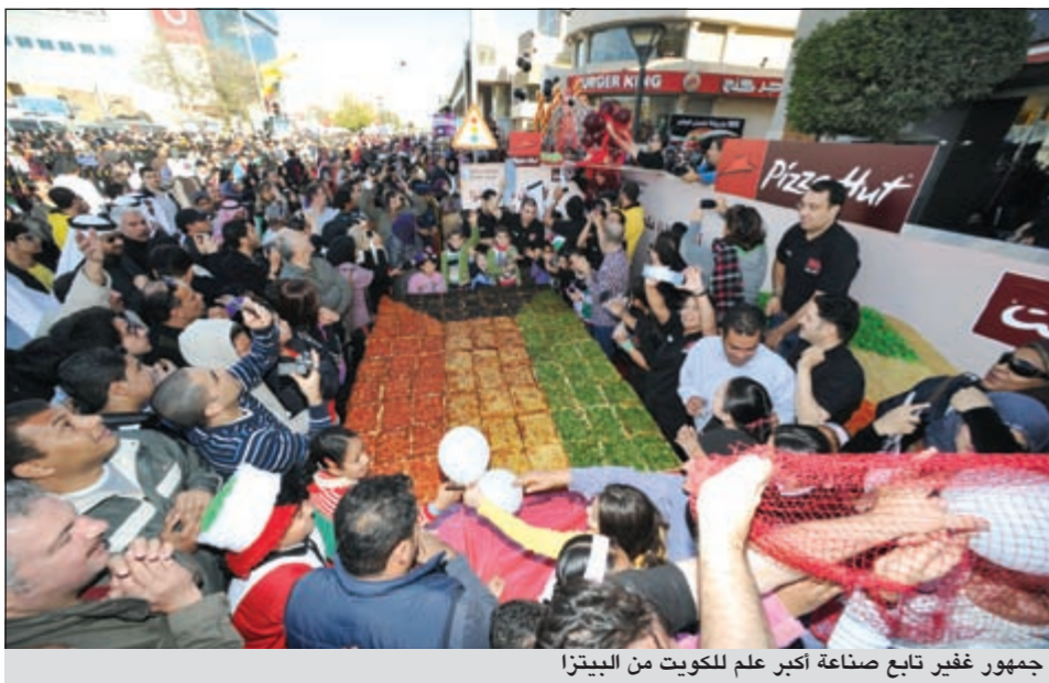
جمهور غير تابع صناعة أكبر علم للكويت من البيتزا

قامت سلسلة مطاعم بيتزا هت بتصنيع أكبر علم للكويت من البيتزا احتفالاً بعيد الوطني والتحرير وذلك ضمن أنشطة افتتاح مهرجان هلا فبراير 2012.