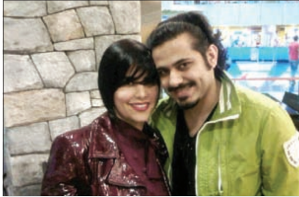
..وفي صورة تجمعها مع شمس