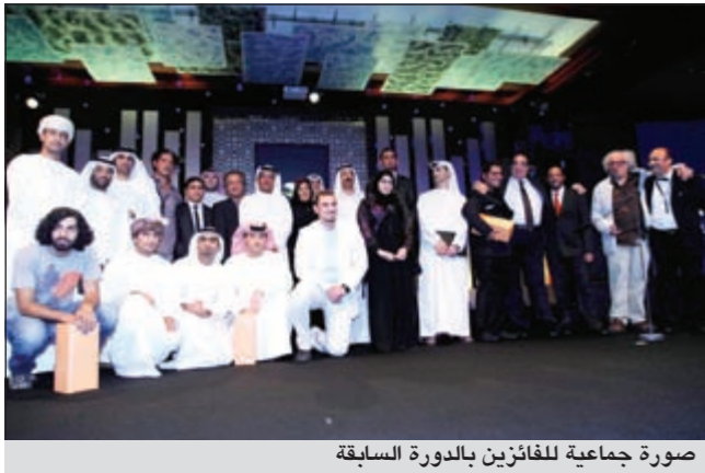
صورة جماعية للفائزين بالدورة السابقة