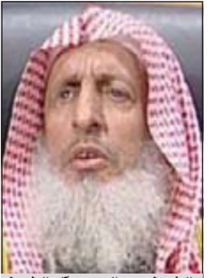
الشيخ عبدالعزيز آل الشيخ

نفت الأمانة العامة لهيئة كبار العلماء وجود أي صفحة في مواقع التواصل الاجتماعي خاصة بالشخصية عبد العزيز بن عبدالله آل الشيخ مفتي عام المملكة العربية السعودية، ورئيس هيئة كبار العلماء ورئيس اللجنة الدائمة للبحوث العلمية والافتاء. وبحسب صحيفة «سبق» فقد أهابت الأمانة بالجميع تحري الصدق والبعد عن الكذب، فذلك الذي يشد أزر المجتمع الإسلامي في بناءه للعقول والأفئس للبحث عن الحق واعتماد الدليل في ضوء قوله تعالى (قل) هاتوا برهانكم ان كنتم صادقين أوضح ذلك الأمين العام لهيئة كبار العلماء د.فهد بن سعد الماجد. يشار إلى أن مواقع التواصل الاجتماعي «تويتر»، «الفيس بوك» سجلت فيها صفحات مزورة تحمل اسم سماحة مفتي عام المملكة.