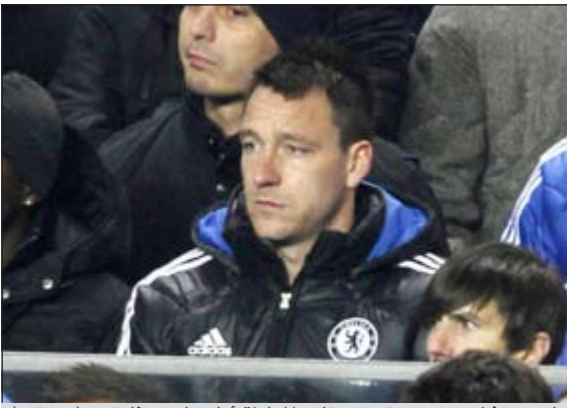
لاعب تشلسي جون تيري يتابع المباراة أمام مان يونايتد

انتقد الإيطالي فابيو كابيللو المدير الفني للمنتخب الإنجليزي قرار اتحاد كرة القدم بتجريد جون تيري من شارة قيادة منتخب بلاده.