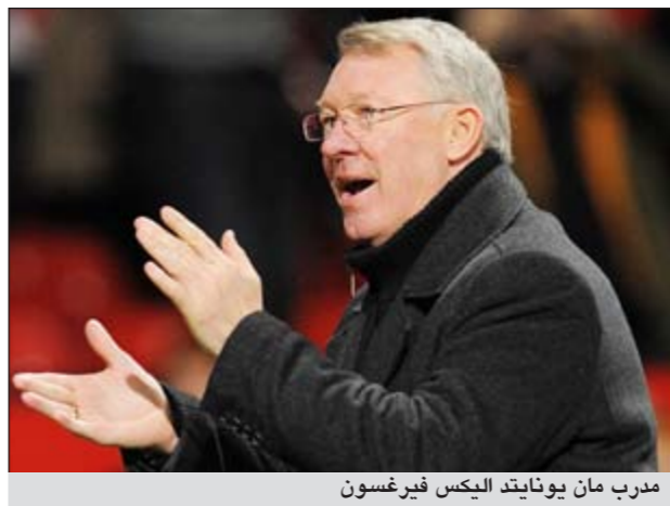
مدرب مان يونايتد اليكس فيرغسون

رونو وتشيتشاريتو. وأضاف «كانت ركلتا الجزاء مرضيتين لنا، لكن كنا نستحق أربع ركلات جزاء».