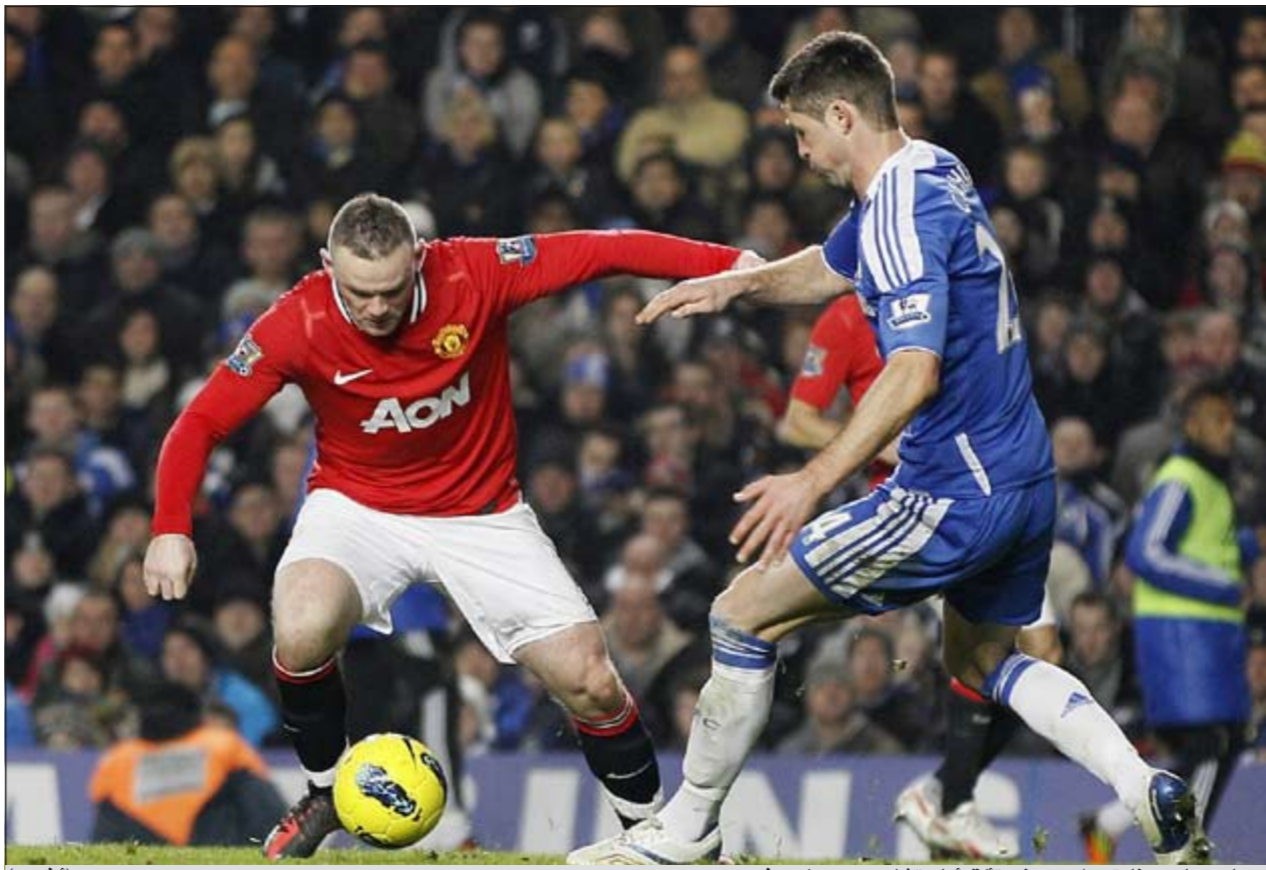
مهاجم مان يونايتد واين روني تالق أمام تشلسي وسجل هدفين

وجه البرتغالي أندري فيلاس بواس المدير الفني لفريق تشلسي سهام النقد إلى الحكم هوارد ويب الذي أدار المباراة التي تعادل فيها فريقه مع ضيفه مان يونايتد 3-3. وقال بواس خلال المؤتمر الصحفي للمباراة «نتوقع في المباريات الكبرى أن يجلبوا لنا حكاما على المستوى، ولكن ذلك لم يحدث معنا، لم يحدث معنا في أولد ترافورد عندما احتسب الحكم هدفين من تسلل وربما القرارات المشبوهة أسفرت في النهاية عن قلب نتيجة المباراة». وتابع «الشيء الأكثر إحباطا خلال المباراتين كان الحكم، حيث كان لهم أثر مباشر على النتيجة».