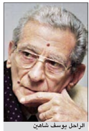
الراحل يوسف شاهين

وسيعرض غداً فيلم «الشرارة» للمخرج إسلام بلال و«العبيدية» للمخرج أحمد خليل و«فخر الرهينة» للمخرج ميشيل منير و«صخور الإيمان» للمخرج جون أكرم و«ظلال» للمخرج مؤمن ممدوح و«ورقة بيضاء» للمخرج رامي شوقي و«ميني