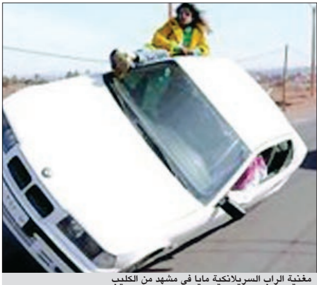
مغنية الراب السريلانكية مايا في مشهد من الكليب

وظهر الفيديو كليب مايا لاغنية «الفتيات المتحدرات» بلهجة خطاب سياسي من خلال توصيل قضية قيادة المرأة السعودية للسيارة، ومناقشة بعض الممارسات الخاطئة كالتزلج على الأسفلت تقليداً لمقطع فيديو انتشر في المواقع الإلكترونية الأجنبية يظهر مجموعة من الشباب السعوديين هوايتهم بالتزلج على الأسفلت. وتطرق المغنية مع طاقم العمل إلى ظاهرة التفحيط والتجمهر، إذ أظهر الكليب شبانا مراهقين يرتدون الزي السعودي، وتظهر لقطات أخرى توضح سيارات تسير على عجلتين، وفي إحداها تظهر المغنية وهي جالسة على نافذة السيارة، وتلقم أظفارها، تقليداً لشاب سعودي يقدم القهوة العربية إلى زميله في