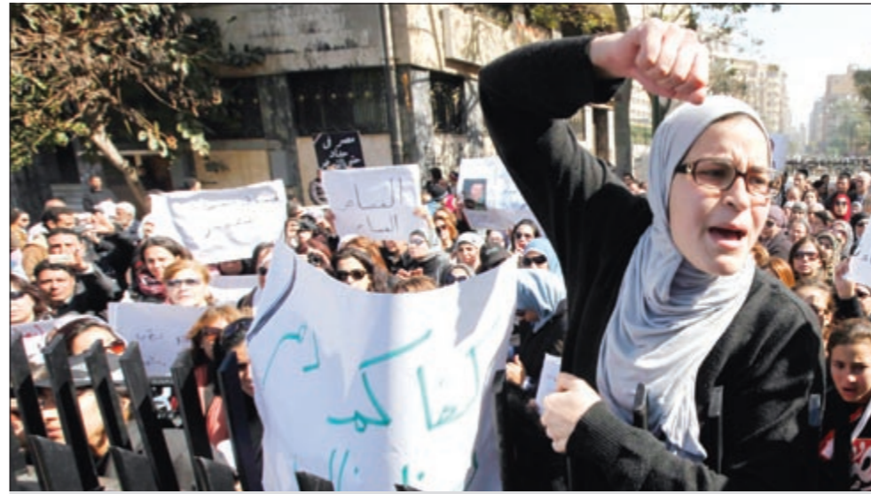
تظاهرات نسائية بالقرب من مجلس الشعب تنادي بسقوط العسكر