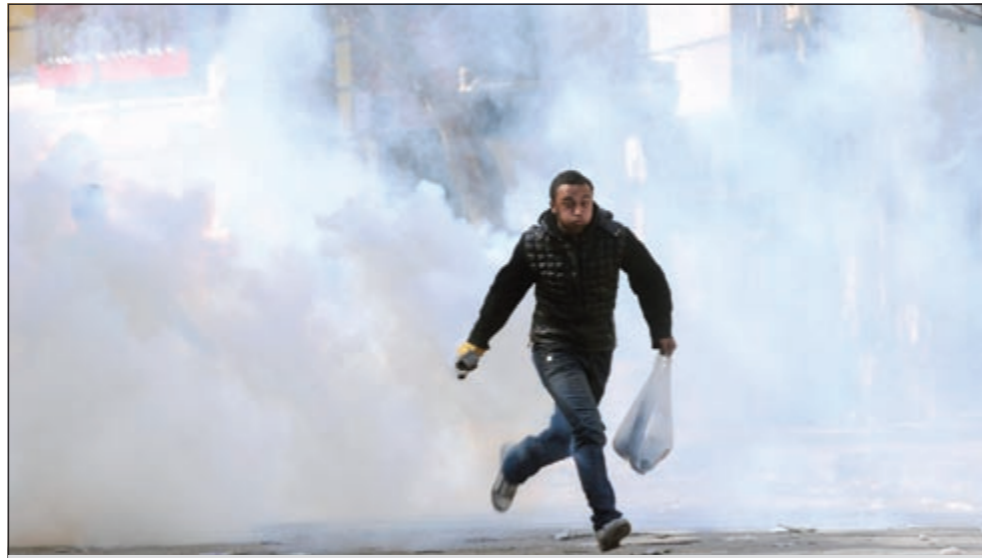
أحد المتظاهرين يحاول الهرب من قنابل الغاز بالقرب من وزارة الداخلية