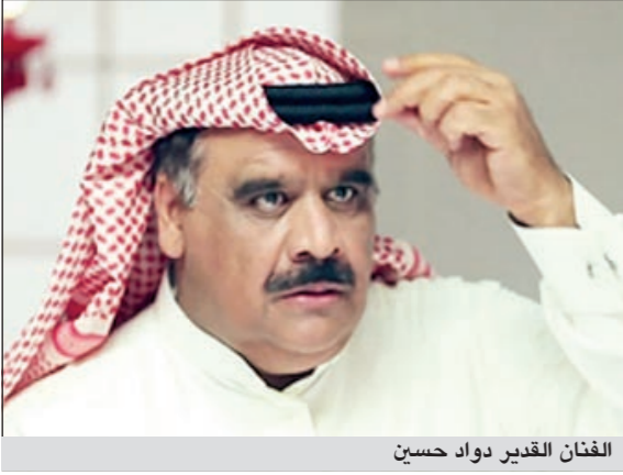
الفنان القدير داود حسين

القاهرة: وقع الفنان القدير داود حسين عقد أولى بطولاته في الدراما التلفزيونية المصرية من خلال مسلسل بعنوان «الواد مشعل» وتشاركه البطولة النسائية فيه الفنانة داليا مصطفى. ويقوم داود، وحسب «إيلاف»، بدور شاب اسمه «مشعل الجنائي» من أم كويتية وأب مصري يعيش حياته في الكويت إلى أن تتعثر به الظروف، ويواجه الكثير من الأزمات والمصائب، مما يجعل والدته تنصحه بضرورة النزول إلى مصر حيث يتواجد أقاربه في الصعيد، وبالعقل يغادر الكويت وتبدأ الأحداث الكوميدية منذ اللحظة الأولى لوجوده في مصر. وسيتم تصوير 7/1 من أحداث المسلسل في الكويت، وباقي الأحداث سيتم تصويرها في محافظات مختلفة من مصر من بينها بورسعيد، والجيزة، والقاهرة. ومن المقرر أن يبدأ التصوير 10 مارس المقبل وذلك استعدادا لعرشه في الموسم الرمضاني المقبل.