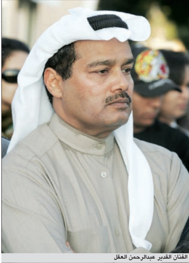
الفنان القدير عبدالرحمن العقل

صدما في حياته الزوجية. ويسأله عن سبب ابتعاده عن الإنتاج أجاب العقل: هذا السؤال أوجهه أيضا إلى المسؤولين الكويتيين، متسائلا: هل هي حرب أم تجاهل في كل إدارات