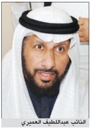
النائب عبداللطيف العميري