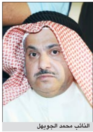
النائب محمد الجويهل