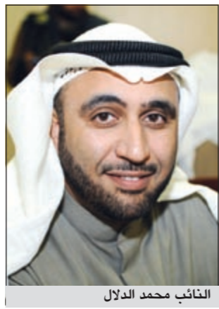
النائب محمد الدلال