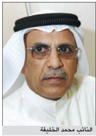
النائب محمد الخليفة