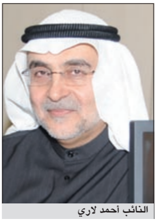
النائب أحمد لاري