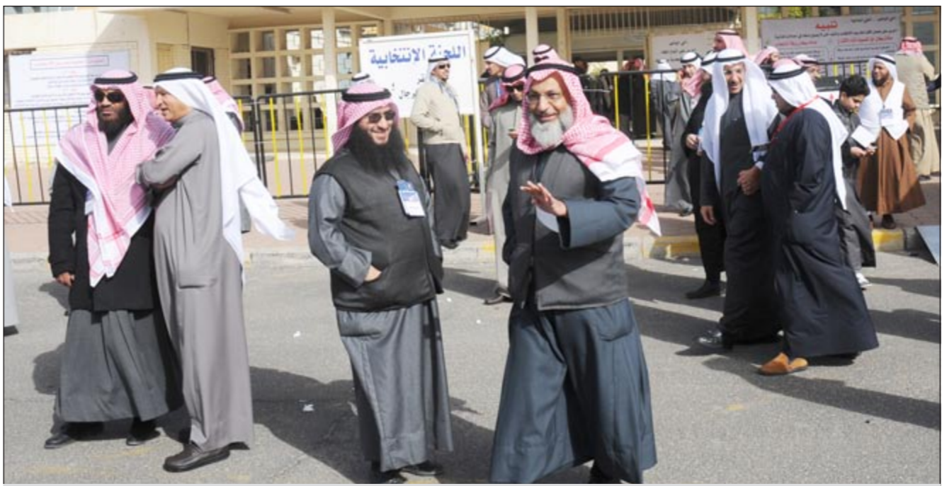
من انتخابات أمة 2012