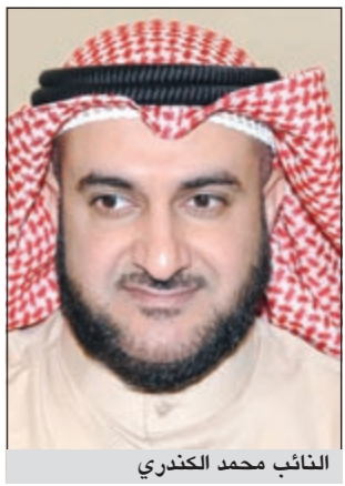
النائب محمد الكندري

في الانتخابات التي تلي خسارتهم على استمرار تواصل المرشح مع اهالي دائرته واعادة قراءته لتكتيكاته الانتخابية نحو الأفضل، ويعكس هذا النموذج فضلاً عن الإصرار على الوصول الى مجلس الأمة تحقيقه في التعبير عن أفكار وأطروحات ظل يؤمن بها وأراد إيصالها والتعبير عنها في حصن الديموقراطية ومركزها الرئيسي مجلس الأمة. وهناك مرشحون حلوا اول الخاسرين لدورتين متتاليتين، لكن هؤلاء أتروا الانسحاب في الدورة الثالثة وابتعدوا تماماً عن المعتزك السياسي، ويعكس هذا التوجه حالة عدم صبر سياسي او مرز اسماء لامعة تتمتع بكاريزما تخطف الأضواء في الدائرة ومن ثم ثقة الناخبين. هناك نماذج سجلتها الانتخابات الكويتية في معظم دوراتها، منها ان اصحاب المراكز المتأخرة في الانتخابات السابقة بحلول احياناً اولاً في الانتخابات التالية، وهو مؤشر مهم يستحق الدراسة حول ما اذا كان المرشح اعتمد في نجاحه على تحالفات ام اعد تنظيم تكتيكاته الانتخابية او لجا الى الصوت الاعور. ومثلما يصعد اوائل الخاسرين الانتخابات لعضوية المجلس في الانتخابات التالية فإن النواب انفسهم سواء كانوا يحتلون المركز الاول او الثاني يعودون الى مراكز متأخرة، وهو ما يعرف بالسقوط المدوي، او عدم التوفيق، وهنا يمكن تفسير الظاهرة بوضوح، لأن النائب الذي تراجع من المركز الاول الى مركز متأخر من المؤكد ان هناك اسباباً منطقية لتراجع ابرزها: تراجع التيار السياسي الذي ينتمي اليه او لتراجع أداء النائب تحت قبة البرلمان وتراجع التزاماته التي قطعها مع الناخبين او عدم تأثيره في الموضوعات المطروحة امام المجلس او نهاونه بنظر ناخبه في قضايا مهمة كان يجب ان يكون ادائه بها مختلفاً او ما شابه ذلك.