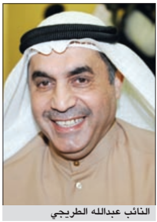
النائب عبدالله الطرجي