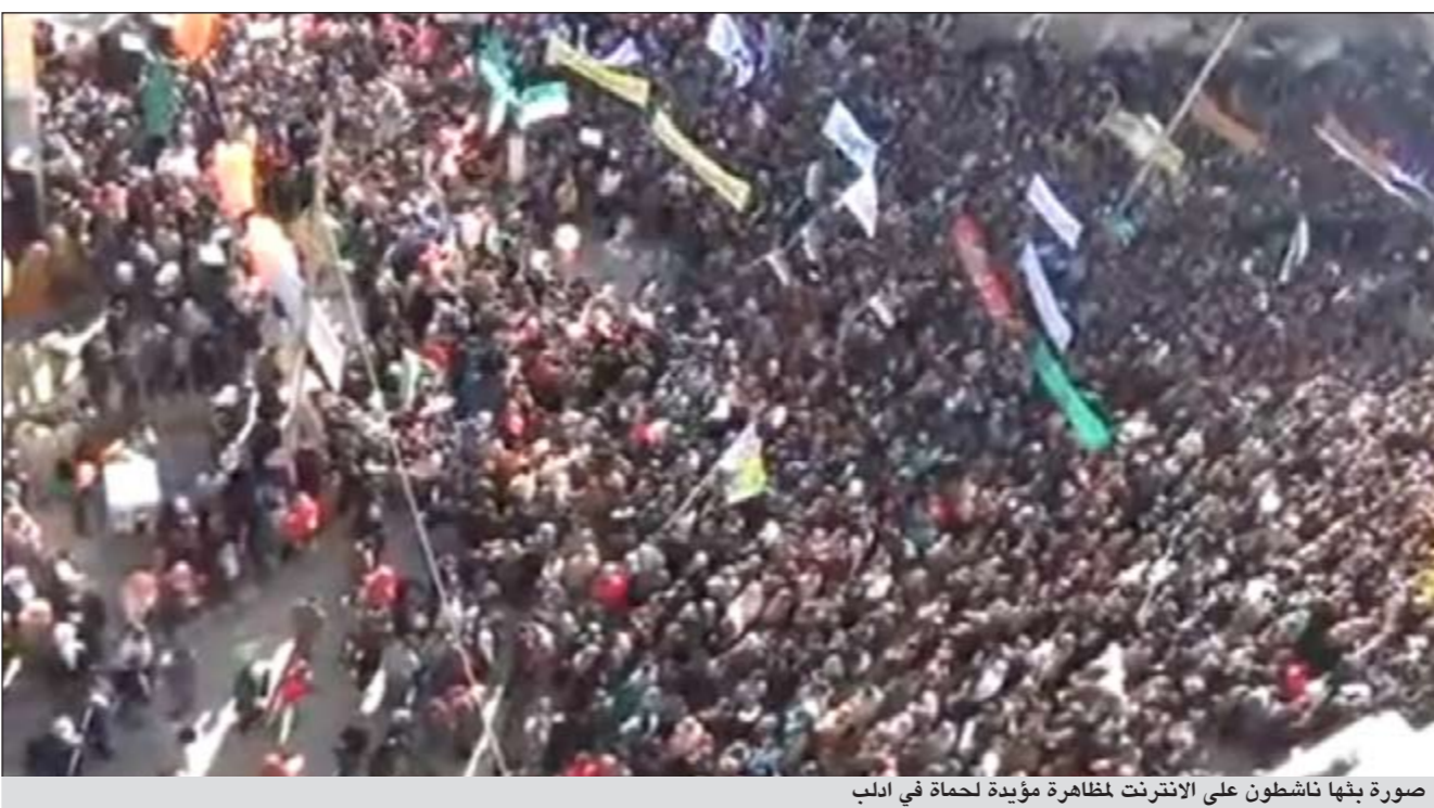
صورة بثها ناشطون على الإنترنت لمظاهرة مؤيدة لحماة في ادلب

السورية، رغم حملة القمع المستمرة التي اسفرت حتى الآن عن مقتل ستة آلاف شخص على الأقل منذ منتصف مارس. وعلى الأرض، خرجت مظاهرات في درعا وفي اللاذقية وفي ريف دمشق خلال ساعات الصباح تعرضت لإطلاق نار، كما حصلت اشتباكات بين الجيش السوري ومجموعات منشقة. وقد سجلت الهيئة العامة للثورة السورية ولجان التنسيق والمنظمات الحقوقية ارتفاع عدد قتلى امس الى 33 برصاص قوات الأمن والجيش بينهم طفلان وامراة وجنديان من الجيش الحر، ومعظمهم في ريف دمشق حيث تجاوز عدد القتلى فيها 9 بينما سقط في حلب نحو 8 وفي حماة صاحبة الذكرى سقط ما لا يقل عن 5 قتلى، كما سقط قتلى آخرون في حمص وادلب والرقعة ودرعا.