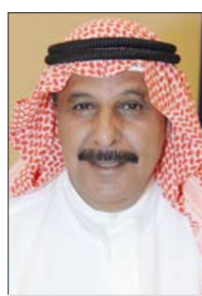
الفريق غازي العمر

وقال الفريق العمر في البرقية ان تلك الجهود جاءت على أعلى مستويات العمل الأمني المشرف والمظهر الحضاري الرائع «والذي انعكس ميدانيا على ارض الواقع والتابع من ادراككم ووعيكم وتحملكم أمانة المسؤولية بكل تفان وإخلاص». وأضاف انكم ترجمتم بجهدكم الخلاق وإخلاصكم المتواصل العهد الذي قطعه نائب رئيس مجلس الوزراء وزير الدفاع ووزير الداخلية على نفسه بأن تكون الانتخابات آمنة وعادلة ونزيهة فكان له ما أراه «فأهنا واعتزازا وتقديرا منا جميعا لحكمته وفكره العميق في دقة القيادة وحسن الإدارة».