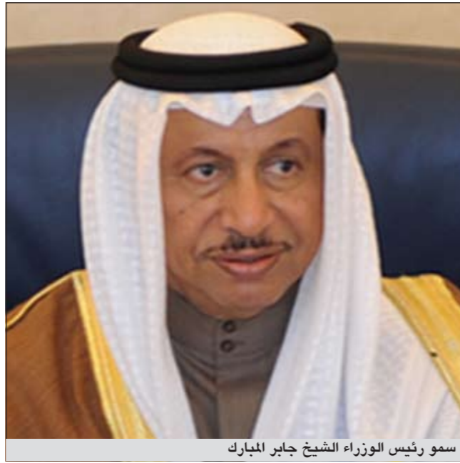
سمو رئيس الوزراء الشيخ جابر المبارك

والنماء. واعرب عن خالص الشكر والتقدير والثناء لجميع المعنيين في الوزارات والجهات الرسمية من عسكريين ومدنيين وجمعيات النفع العام ومنظمات المجتمع المدني وللقضاة والمستشارين على الاحساس بجسامة المسؤولية والجهد المضني والكبير والاعداد المهني المنظم والتنفيذ المحترف الدقيق بما حقق تطلعاتنا جميعا في انتخابات نزيهة وشفافة وفي عرس ديموقراطي جميل نسأل الله أن تجني الكويت واهلها من خلاله الخير والرفاهية والتطور الامن والاستقرار. داعيا الجميع الى تجاوز الماضي والبعد عن التنازع والاختلاف والتطلع الى المستقبل من اجل الكويت التي نتمناها دار عز وكرامة وآباء تحت القيادة الحكيمة لصاحب السمو الامير الشيخ صباح الاحمد وسمو ولي عهده الامين.