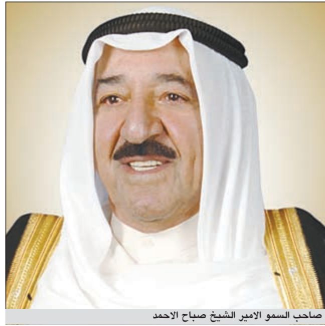
صاحب السمو الامير الشيخ صباح الاحمد

وبعث سمو ولي العهد الشيخ نواف الأحمد ببرقيات تهنئة لأعضاء مجلس الأمة ضمنها سموه خالص تهانئه بمناسبة فوزهم بعضوية مجلس الأمة، متمنيا لهم كل التوفيق والسداد لخدمة الوطن العزيز ورفع رايته. كما بعث سمو رئيس مجلس الوزراء الشيخ جابر المبارك ببرقيات تهنئة ماثلة. هذا ويتقدم سمو رئيس مجلس الوزراء الشيخ جابر المبارك بأخلص التهاني والتبريكات