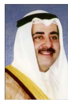
الشيخ أحمد الحمود

اشاد نائب رئيس مجلس الوزراء وزير الدفاع ووزير الداخلية ورئيس اللجنة الأمنية لانتخابات مجلس الأمة 2012 الشيخ أحمد الحمود بنجاح جهود منتسبي وزارة الداخلية في تأمين انتخابات مجلس الأمة التي جرت أمس. ووجه وكيل وزارة الداخلية القائد التنفيذي للجنة الأمنية للاعداد والتحضير والتنفيذ لانتخابات مجلس الأمة 2012 الفريق غازي عبد الرحمن العمر بالانابة عن الشيخ أحمد الحمود برقية شكر لمنتسبي وزارة الداخلية اعرب فيها عن التقدير للأداء الرائع والتنظيم المثالي والتنسيق والتعاون بين