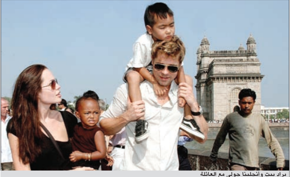
براد بيت وأنجلينا جولي مع العائلة

من ناحية أخرى تتزايد الأخبار عن حمل النجمة الهوليوودية أنجلينا جولي من حبيبها ووالد أطفالها الـ 6 براد بيت لكن الخبر الأجدد هو أنها حامل بتوأم ذكور. ونقلت مجلة «أوكي» الأميركية عن مصدر مقرب من جولي قوله أنها وبيت «مسروران جدا بسرعة حمل أنجلينا هذه المرة». في منتصف فبراير الى البوسنة وكرواتيا برفقة شريكها براد بيت لعرض فيلمها «إين ذي لاند أوف بلود أند هوني» الذي تدور أحداثه حول أعمال العنف التي تعرضت لها النساء خلال النزاع في البوسنة. ويحكي الفيلم قصة حب تنشأ بين شابة مسلمة وشباب صربي يجدان نفسيهما في معسكرين متناحرين بعد نشوب النزاع. وحسب المنظمات المحلية، تعرضت 20 ألف امرأة معظمهن من المسلمات لاعتداءات جنسية خلال نزاع البوسنة الذي ذهب ضحيته 100 ألف شخص.