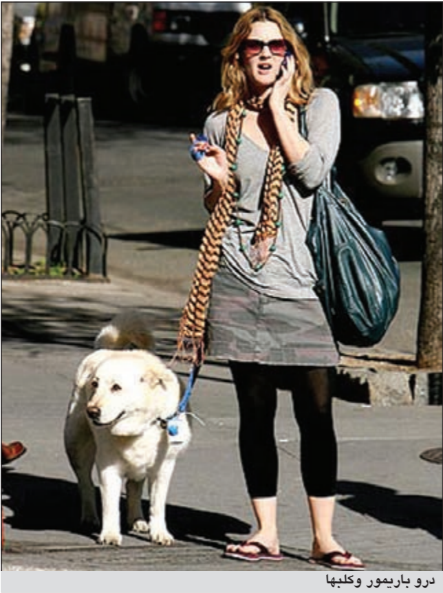
درو باريمور وكتبها

لوس أنجليس - يوبي.آي: أقدمت النجمة الأميركية درو باريمور وخطيبها نيل كوبلمان على خطوة كبيرة جديدة معا بعد فترة قصيرة على خطوبتهما إذ عمدا إلى تبني جرو كلب عمره لا يتعدى 8 أسابيع من أحد المتاجر في هوليوود. وأشار موقع «بيبول» الأميركي إلى أنه بالنسبة إلى باريمور المعروفة بنشاطها في حماية الكلاب والاعتناء بها لم تكن خطوة تبني كلب صغير أمرا مستغربا جدا لكنها بالفعل كذلك بالنسبة لخطيبها الذي لم يسبق أن اقتنى كلبا من قبل. وقال مالك المتجر الذي تبنت منه باريمور وكوبلمان الكلب إنها، كانتا يفكران كثيرا ولم يكونا متهورين في اتخاذ قرارهما. وحب درو الكلب للكلاب كان جيدا بالنسبة لويل وقد أرادت أن يشعر بالامر ويتخذ قرار بنفسه. وأطلق على الجرو اسم «اوليفر» وهو ينتمي إلى مجموعة من الكلاب التي عُثر عليها مرمية في لوس أنجليس قبل أن تهتم بها نجمة «الشفق» نيكى ريد قبل تسليمها إلى المتجر لعرضها للتبني.