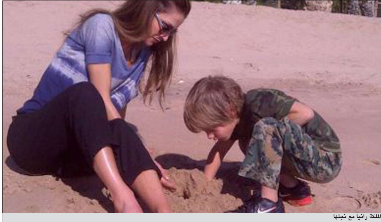
الملكة رانيا مع نجلها

وقال: «لا أعتقد أنني أشبهه، إنه انحف وأكثر وسامة واصفر سناً، لكن إن سألته من سيؤدي دوري في فيلم، لم لا، سأختار براد بيت. يذكر أن بيت كان اعرب عن تأييده للرئيس باراك أوباما».