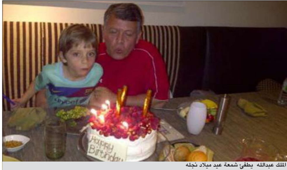
الملك عبدالله يطفى شمعة عيد ميلاد نجله

عمان - ام بي سي: نشرت الملكة رانيا زوجة عاهل الأردن الملك عبدالله، على حسابها الخاص بموقع تويتر، صورة لها وهي تلعب بالرمال مع نجلها الأمير هاشم، وكتبت معلقة على الصورة: أجمل اللحظات تلك التي نقضيها مع ابنائنا، وتأتي هذه الصورة التي نشرتها الملكة رانيا، في وقت احتفلت فيه، أمس، الأسرة بعيد ميلاد الملك عبدالله ونجله الأمير هاشم الذي يوافق 30 يناير.