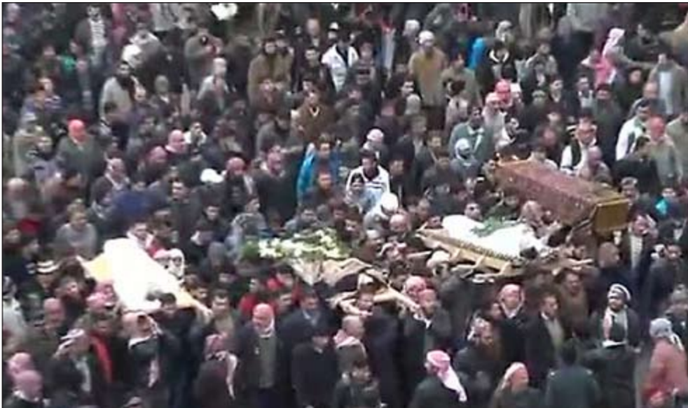
صورة عن الانترنت بينها ناشطون لجنازة عدد من المعارضين قتلوا في ادلب امس (أ.ف.ب)

عواصم - وكالات: يبدو من السجلات التي شهدتها جلسة مجلس الأمن العلنية لمناقشة مشروع القرار العربي - الغربي لحل الأزمة السورية أمس الأول وما تبعها من تصريحات صحافية ونقاشات غير رسمية أمس أن الخلاف ما زال بعيداً عن التوصل الى حل وسط بين الدول الغربية والعربية الداعمة لمشروع القرار الذي يدعو الى تبني المبادرة العربية الأخيرة حول سورية وبين روسيا والصين الداعمتين للنظام السوري اقله في الوقت القريب فيما الدماء السورية مازالت تنزف في أكثر من منطقة حيث قتل أمس فقط أكثر من 60 مدنياً برصاص قوى الأمن إضافة الى عدد من العسكريين.