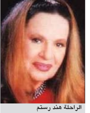
الراحلة هند رستم

هند في النهاية، حسب موقع «السينما كوم»، وقد جاءت نتيجة الاستفتاء بحصول هند رستم على نسبة مئوية بلغت 64,17٪ من جملة الأصوات، بينما جاءت النجمة فاتن حمامة في المركز الثاني بعد حصولها على نسبة 29,17٪ من الأصوات، وفي المركز الثالث جاءت الفنانة ماجدة الصباحي بحصولها على نسبة وصلت إلى 6,67٪ من مجموع الأصوات.