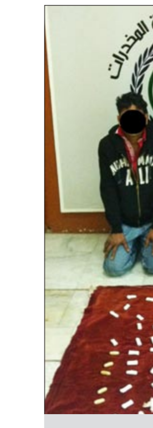
المتهمون وامامهم المضبوطات

تمكن رجال الإدارة العامة لمكافحة المخدرات -إدارة مكافحة المحلية- من إلقاء القبض على 3 وافدين من الجنسية الأسبوية وبحوزتهم نصف كيلو هيروين، حيث وردت معلومات عن ضلوع أحدهم في الاتجار بالمخدرات وبعد القيام بالتحريات والاستدالات والحصول على إذن النيابة العامة، تمت مدهامته في منطقة السالمية وبرفقته المتهم الثاني وبتفتيشهما عثر بحوزتهما على نصف كيلو هيروين، واعترفا على المتهم الثالث الذي تم ضبطه.