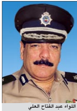
اللواء عبد الفتاح العلي

أعرب قائد قيادة أمن انتخابات الدائرة الرابعة اللواء عبدالفتاح العلي عن ثقته في أن عملية تأمين الانتخابات مجلس الأمة 2012 سوف تتم بمشيئة الله على أحسن ما يكون، موضحا أن المقار الانتخابية تشمل محافظة الفروانية ومحافظة الجهراء وأن عدد مقار الاقتراع في الدائرة يبلغ 23 مقرا تحتوي على 120 لجنة منها 119 لجنة فرعية تتم فيها عملية التصويت وفرز ولجنة واحدة رئيسية تتم فيها عملية التجميع لأصوات الناخبين وتقع في مدرسة الاندلس الابتدائية للبنات، ومشيرا في الوقت ذاته إلى أنه نظرا لاتساع الدائرة وحجمها ومساحتها الجغرافية وكثافة أعداد الناخبين فيها حيث يبلغ العدد الإجمالي للناخبين (107147 ناخبا منهم 47371 ذكورا) و (59776 ناخبا)، فقد تم تقسيم الدائرة إلى قطاعتين يرأس كلا منهما ضابط برتبة لواء ليكون مسؤولا عن متابعة العملية الانتخابية. هذا وقد أشار اللواء عبدالفتاح العلي إلى أنه تم إعداد خطة أمنية شاملة لتأمين سير العملية الانتخابية من بدايتها حتى نهايتها وذلك من خلال التواجد الأمني في المقار الانتخابية على مدار الساعة منذ تاريخ تسلمها وحتى الانتهاء من عملية الاقتراع وإعلان النتائج مؤكدا على أن الخطة الأمنية تتضمن تسهيل حركة مرور المركبات ومنع عرقلتها من خلال عدم السماح بوقوف المركبات أمام مقار اللجان الانتخابية أو في محيط الطرق المؤدية إليها وتسهيل حركة دخول وخروج الناخبين من وإلى اللجان الانتخابية بشكل يمكنهم من الإدلاء