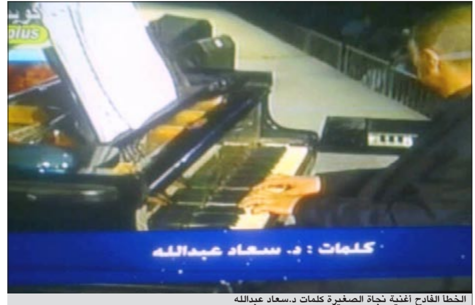
الخطا الفادح أغنية نجاة الصغيرة كلمات د.سعاد عبدالله

الذي استغربه المشاهدون بأن تلفزيونا حكوميا خطئي هذا الخطا الفادح ويستمر في خطئه دون تنويه من قبل مذيعي البرنامج بأنهم سيغفون أغنية لنجاة الصغيرة بعنوان «لا تتنقد خجلي» والتي صاغت كلماتها الشاعر د.سعاد الصباح، ولكن بعد عرض الأغنية كتب في الشريط المرفق مع الأغنية انها من كلمات د.سعاد عبدالله الأمر