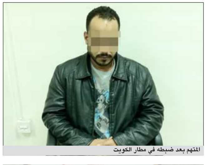
المتهم بعد ضبطه في مطار الكويت