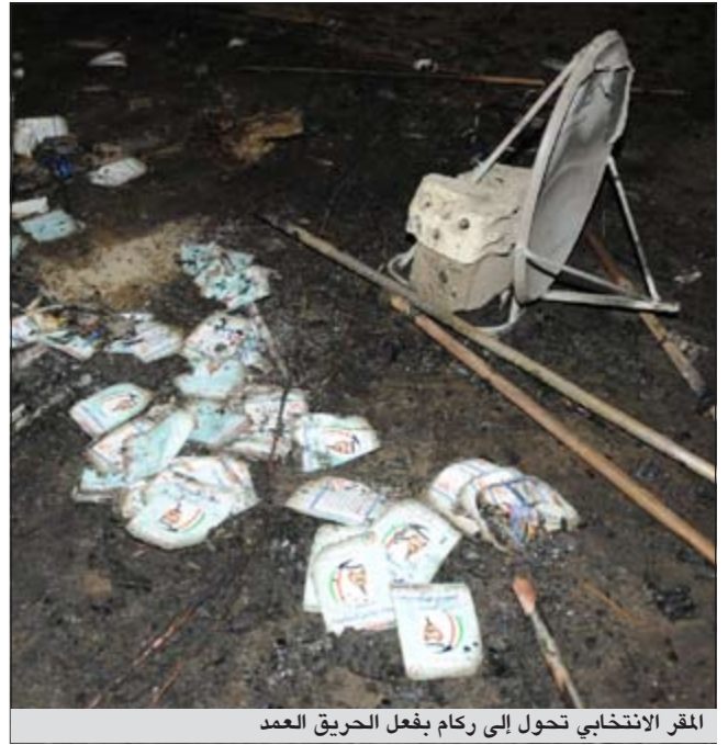
المقر الانتخابي تحول إلى ركام بفعل الحريق العمد

وحول برنامج الانتخابي قال المطوع أنه يتركز حول أهمية مكافحة الفساد بكل أشكاله وأنواعه من خلال إصدار التشريعات اللازمة والخاصة بقانون الهيئة العامة لمكافحة الفساد وقانون مكافحة الكسب