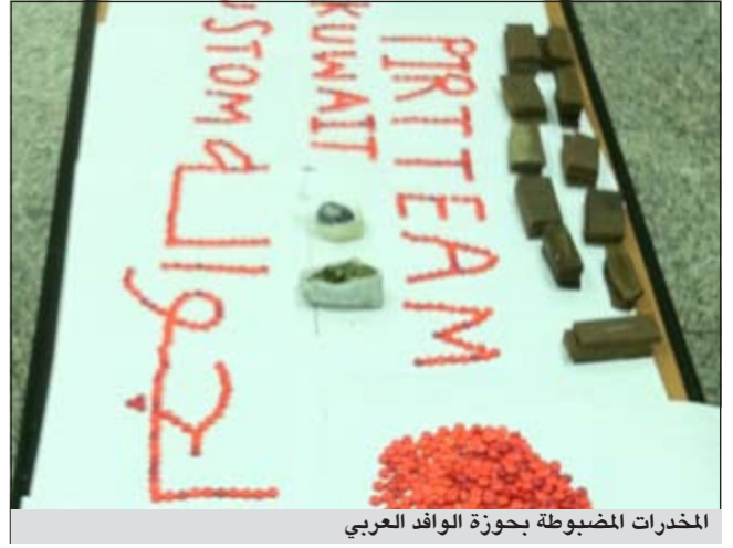
المخدرات المضبوطة بحوزة الوافد العربي