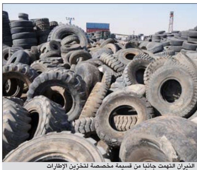
التي تهمت جانباً من قسيمة مخصصة لتخزين الإطارات