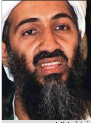
اسامة بن لادن

إسلام آباد - العربية: أكد زكريا السادة شقيق أمل السادة زوجة زعيم تنظيم القاعدة أسامة بن لادن والمتواجد حاليا في العاصمة الباكستانية إسلام آباد أن زوجات بن لادن الثلاث لازلن محتجزات لدى السلطات الأمنية الباكستانية التي ترفض حتى الآن الإفراج عنهن على الرغم من أنه تم الانتهاء من التحقيق معهن وفق ما قاله السادة.