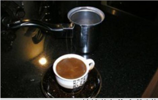
فنجان القهوة بـ 60 جنيهًا إسترلينيًا

قشرتها فقط فتخرج الحبة مع فضلاته كما هي، ومن هنا يقوم المزارعون بجمع هذه الحبوب يدويا ثم يغسلونها ويحمصونها بشكل بسيط لتفادي تحطم مركباتها المعقدة والتي تضيف نكهة خاصة للبن. والغريب والمثير للاشمئزاز هو أن المقهى يزعم أن أحماض معدة هذا الحيوان هو سر مذاقها اللذيذ حيث تختلط عصارة معدته مع حبات البن مضيفا طعما ورائحة مختلفة. ويميل لون حبات القهوة إلى لون القرفة المحمر أما شرايبها فهو معدوم السكريرات ونكهته قوية بالنسبة للذين يتذوقونه لأول مرة.