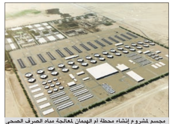
مجسم لمشروع إنشاء محطة أم الهيمان لمعالجة مياه الصرف الصحي

قام الجهاز الفني لدراسات المشروعات التنموية والمبادرات في الكويت بإطلاق مشروع إنشاء محطة أم الهيمان لمعالجة مياه الصرف الصحي رسمياً من خلال إصدار طلب تقديم عروض إيداء الرغبة من شركات القطاع الخاص لبناء وتطوير محطة جديدة لمعالجة مياه الصرف الصحي، مما سيساهم في الطاقة الاستيعابية للمنطقة الجنوبية لمعالجة مياه الصرف الصحي فيها بأكثر من 20 مرة تقريبا مقارنة بالطاقة الاستيعابية للمحطة الحالية. وتجدر الإشارة إلى أن مشروع إنشاء محطة أم الهيمان سيكون ثاني مبادرة لقطاع معالجة مياه الصرف الصحي يتم تطويرها في الكويت ضمن إطار نموذج شراكة بين القطاعين العام والخاص، بحيث سيتم بناء وتحويل وتمليك وتشغيل المحطة بالشراكة مع شركات القطاع الخاص.