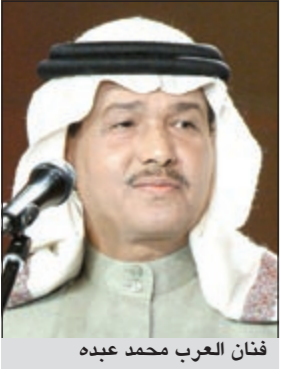
فنان العرب محمد عبده

رسائل محبة من هذا الجمهور الكبير الذي شملني باهتمام ليس له حدود، ومن غير الممكن أن أستطيع إحصاء كل تلك الاتصالات التي تحاول الأطمئنان على صحتي حتى إنني لأخال هذه المتابعات أمصال علاج ودواء يمنحني طاقة أكثر مما أتخيل لدعم ما ألقاه من علاج. وقال: خلاصة ما أود قوله إن الفنان بلا جمهور لا يساوي شيئاً، فتخيل جمهور لا يساوي شيئاً، فتخيل أن فناناً ليس له جمهور يهتم به، كيف له أن يعطي وأن يكون له موقع في الخريطة الغنائية والثقافية بشكل عام.