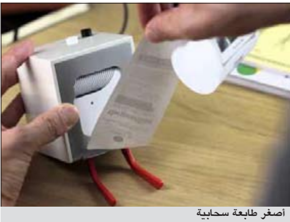
أصغر طابعة سحابية

وكالات: «طابعتي الصغيرة» هو الاسم التجاري لطابعة اعلنت عنها شركة بيرغ التي اطلقتها باعتبارها اصغر طابعة سحابية في العالم، وليست تلك ميزتها فحسب لانها طابعة لا مثيل لها، ان بإمكانك ان تضعها بجانب سيريك لتوظفك في الصباح على اجموع من الاخبار والمقالات والنشرات والألغان من اصدقاتك، تستطيع طباعة كل ذلك في شكل منشورات انيقة مع ابتسامه جميلة من الطابعه! «طابعتي الصغيرة» هي الاولى في عائلة المنتجات التي ستعرف باسم سحب بيرغ، والتي يمكنك ايصالها بالانترنت لاسلكيا، من «الراوتر» مباشرة لتوفر لك جميع الخدمات المتاحة بشكل يومي عبر شبكة الانترنت.